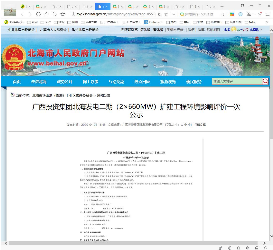
图 1 第一次网络公示图片