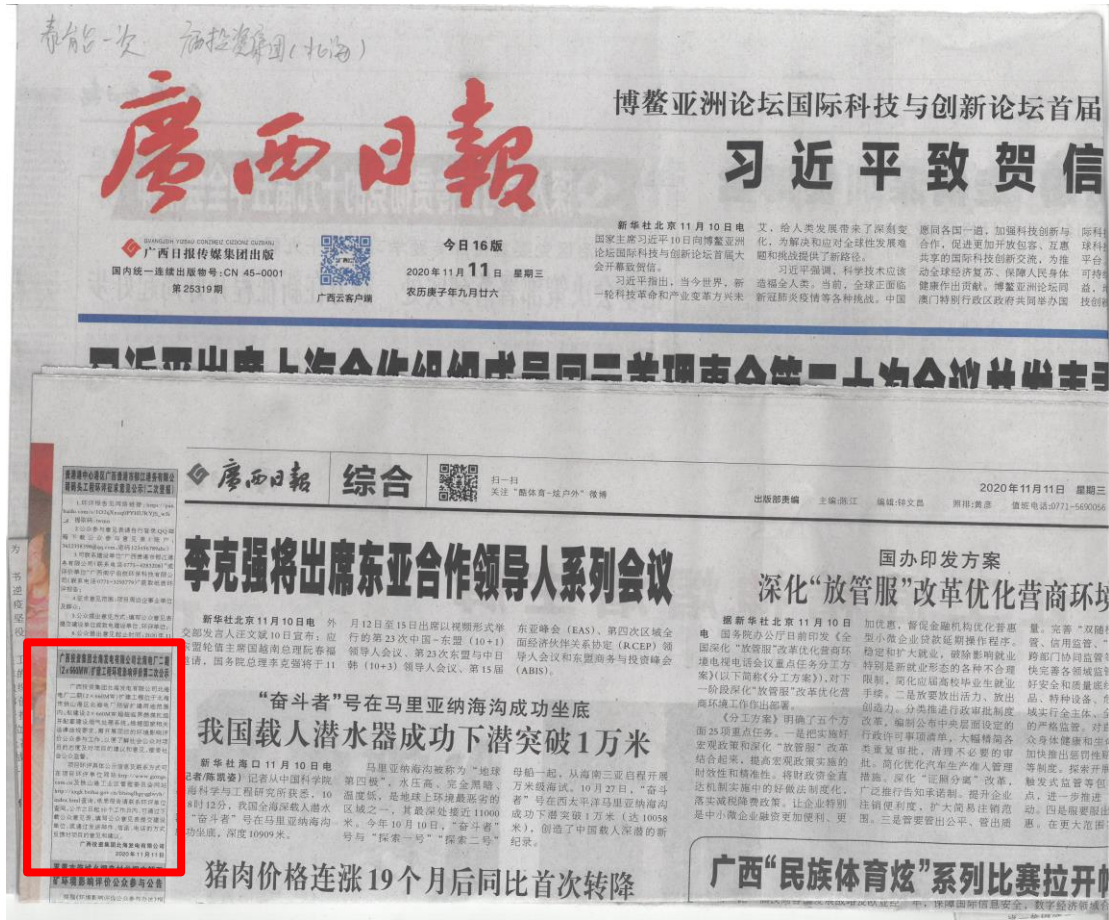
图 5 征求意见稿第一次报纸公示