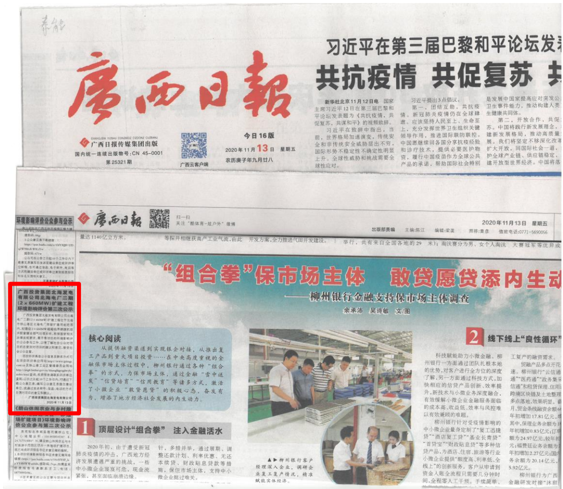
图 6 征求意见稿第二次报纸公示