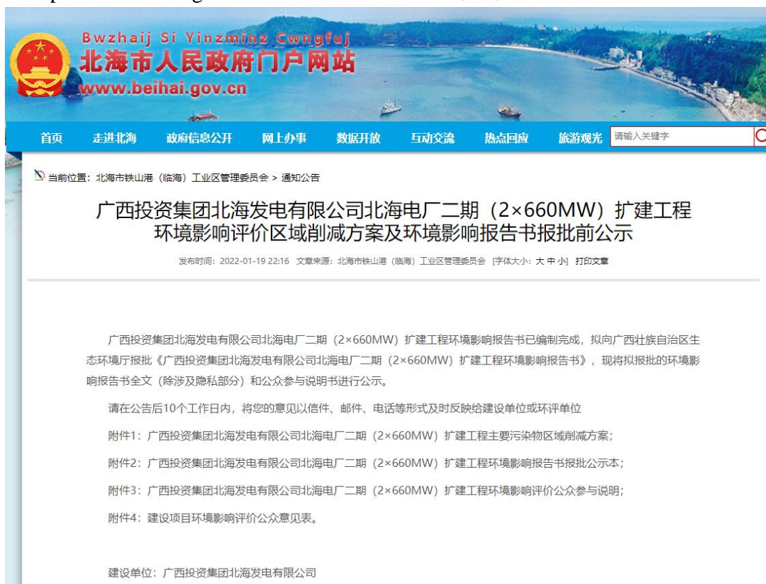
图 7 报批前公示（网站截图）

(http://www.beihai.gov.cn/) 上公示，该网站向社会开放，均可查阅。