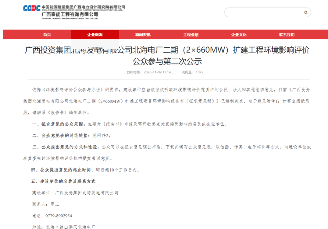
图3 征求意见稿网络公示图片(广西泰能工程咨询有限公司)

建设单位于2020年11月9日起在广西泰能工程咨询有限公司网站( http://www.gxtngs.com.cn/ )、2020年11月24日通过北海市人民政府门户网站( http://www.beihai.gov.cn/ )以网络公告的形式向公众发布征求意见稿公示,公示时间自2020年11月9日起不少于10个工作日。