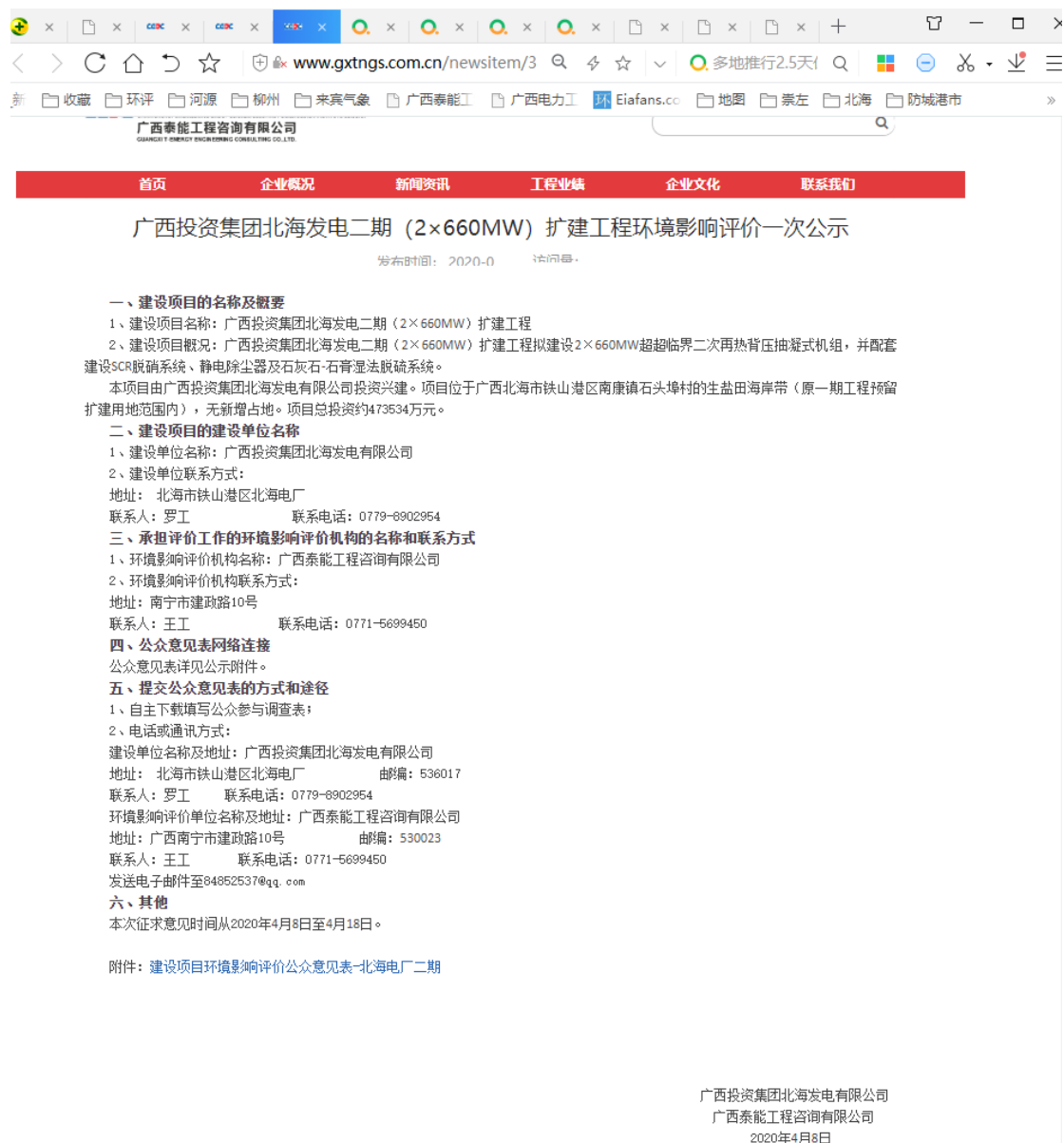
图 1 第一次网络公示图片 (广西泰能工程咨询有限公司网站)