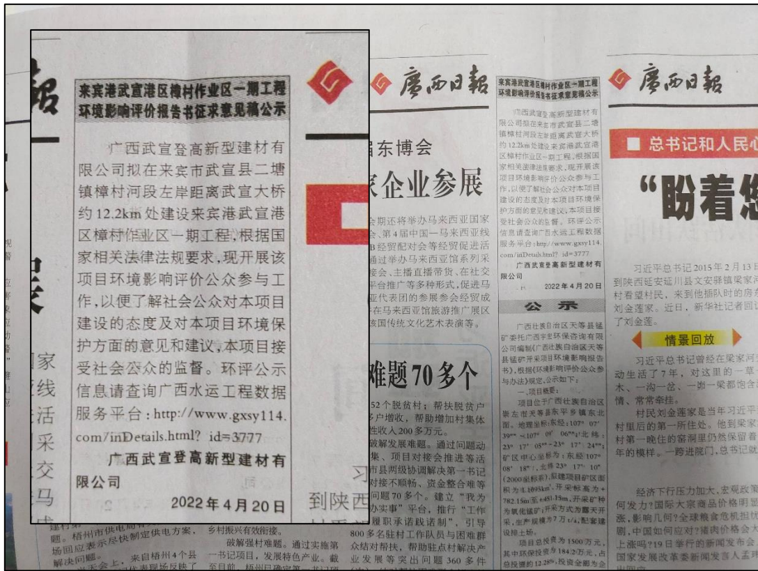
图3 本项目环境影响报告书征求意见稿报纸公示照片（第1次）