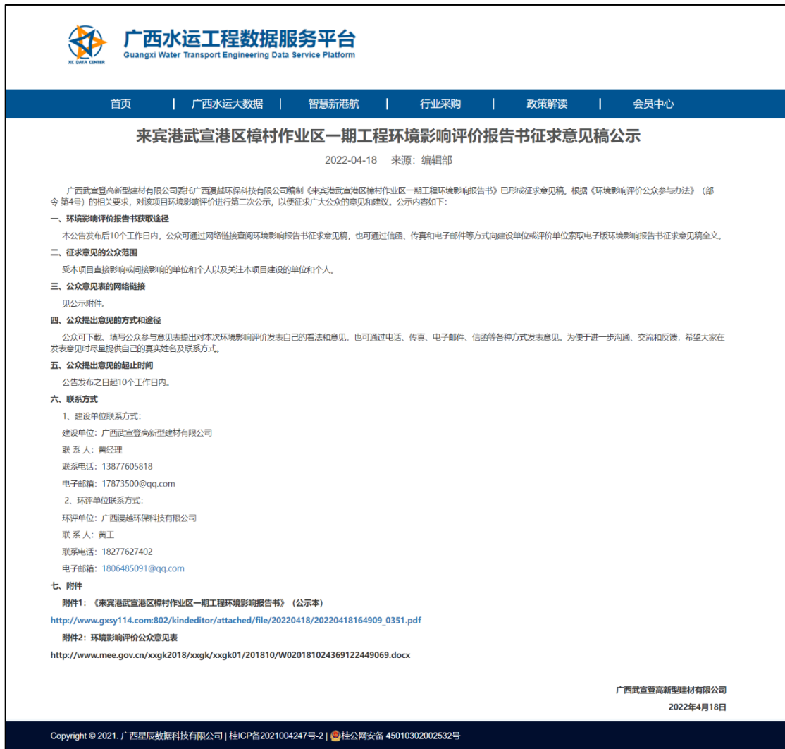
图2 本项目环境影响报告书征求意见稿网上公示截图