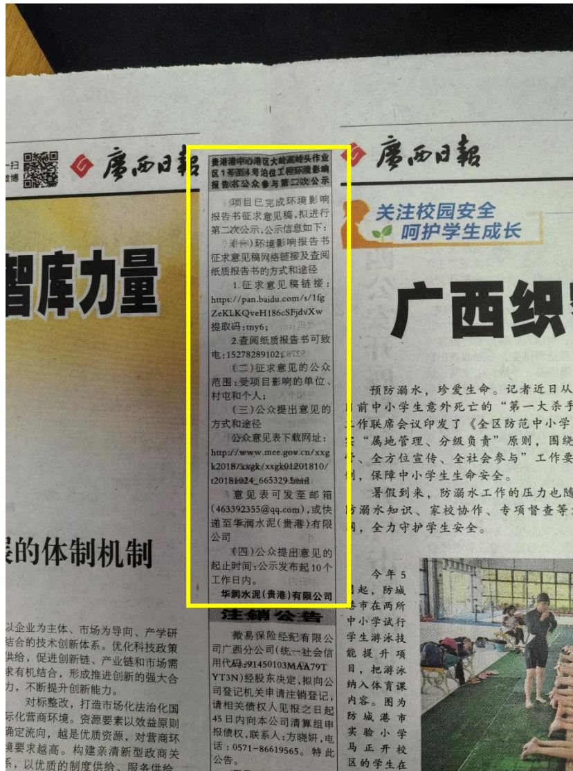
图5 本项目环境影响报告书征求意见稿报纸公示照片(7月6日)