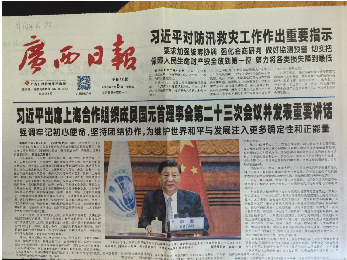
图4 本项目环境影响报告书征求意见稿报纸公示照片（7月5日）