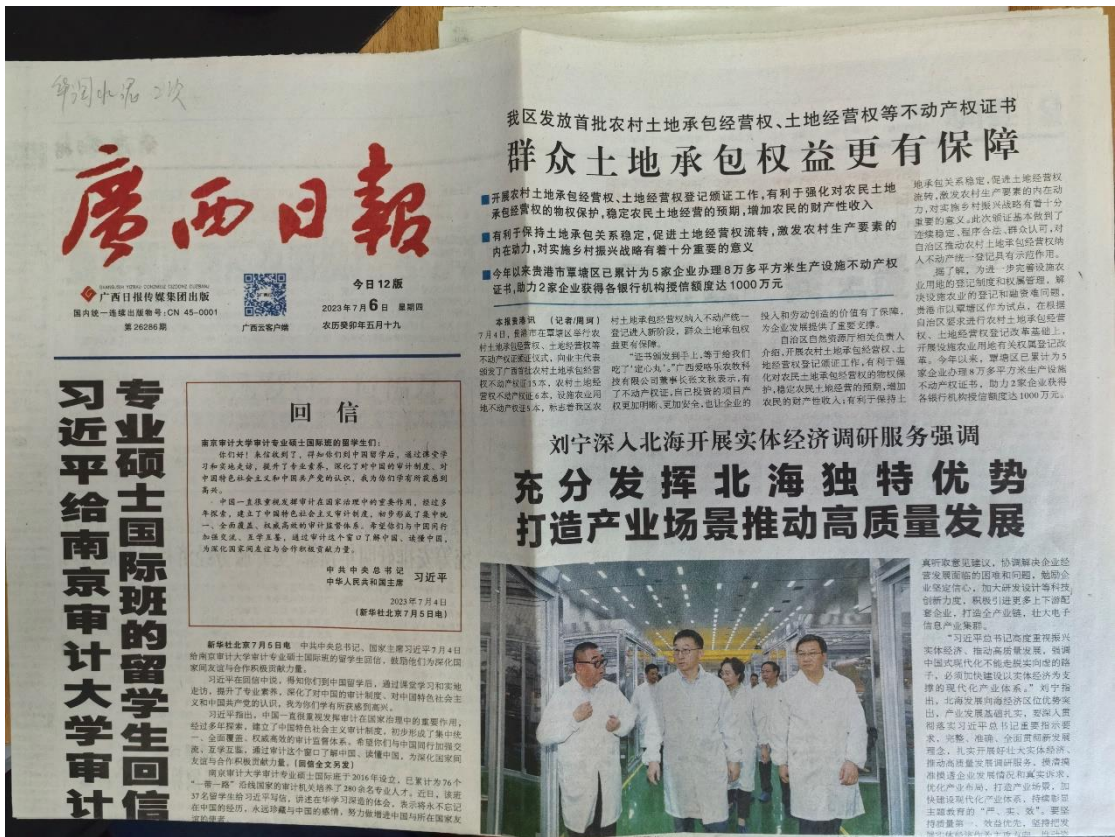
图6 本项目环境影响报告书征求意见稿报纸公示照片（7月6日）