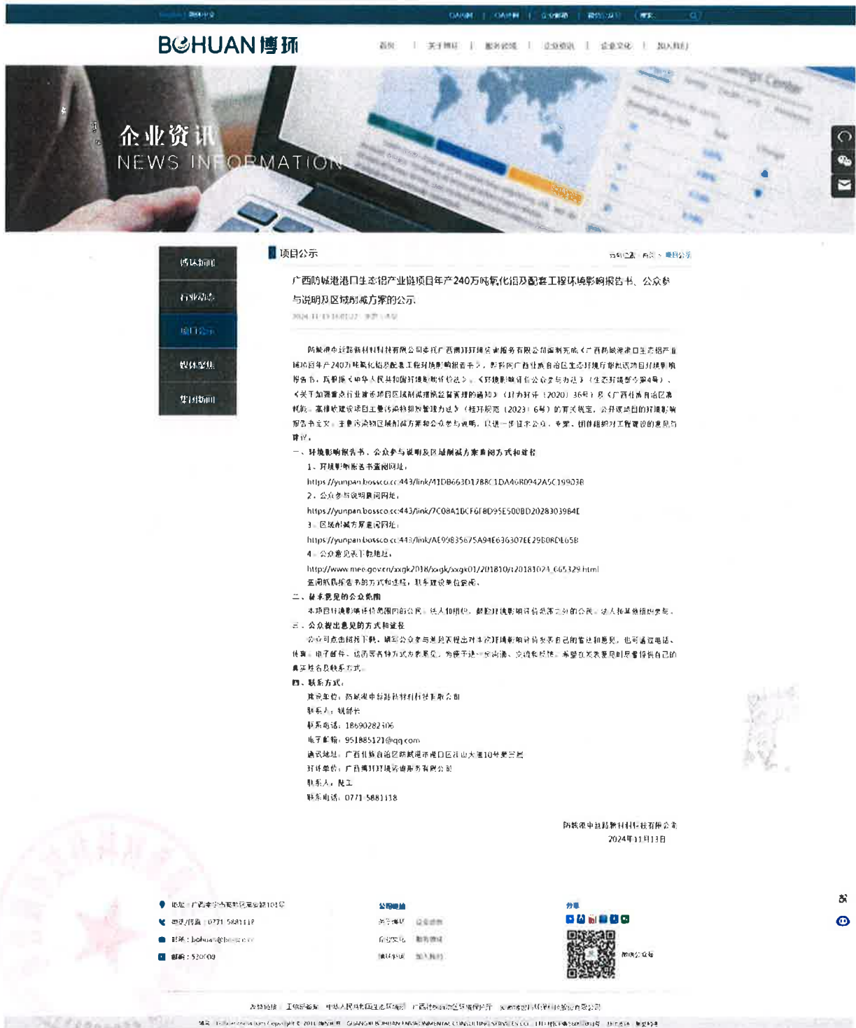
图 6.2-1 报批前公示截图