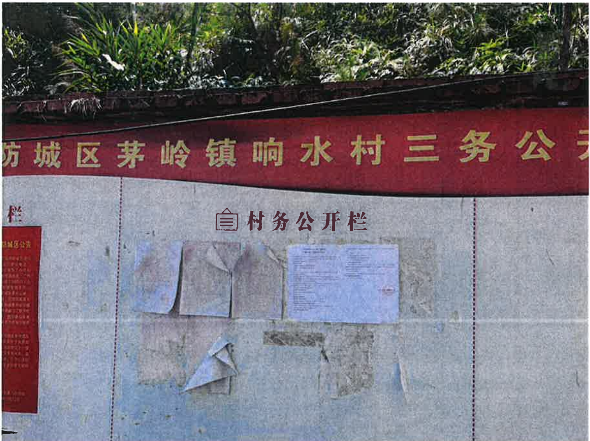
图 3.2-6 响水村公示张贴照片