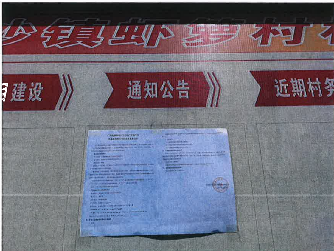
图 3.2-6 虾笋村公示张贴照片