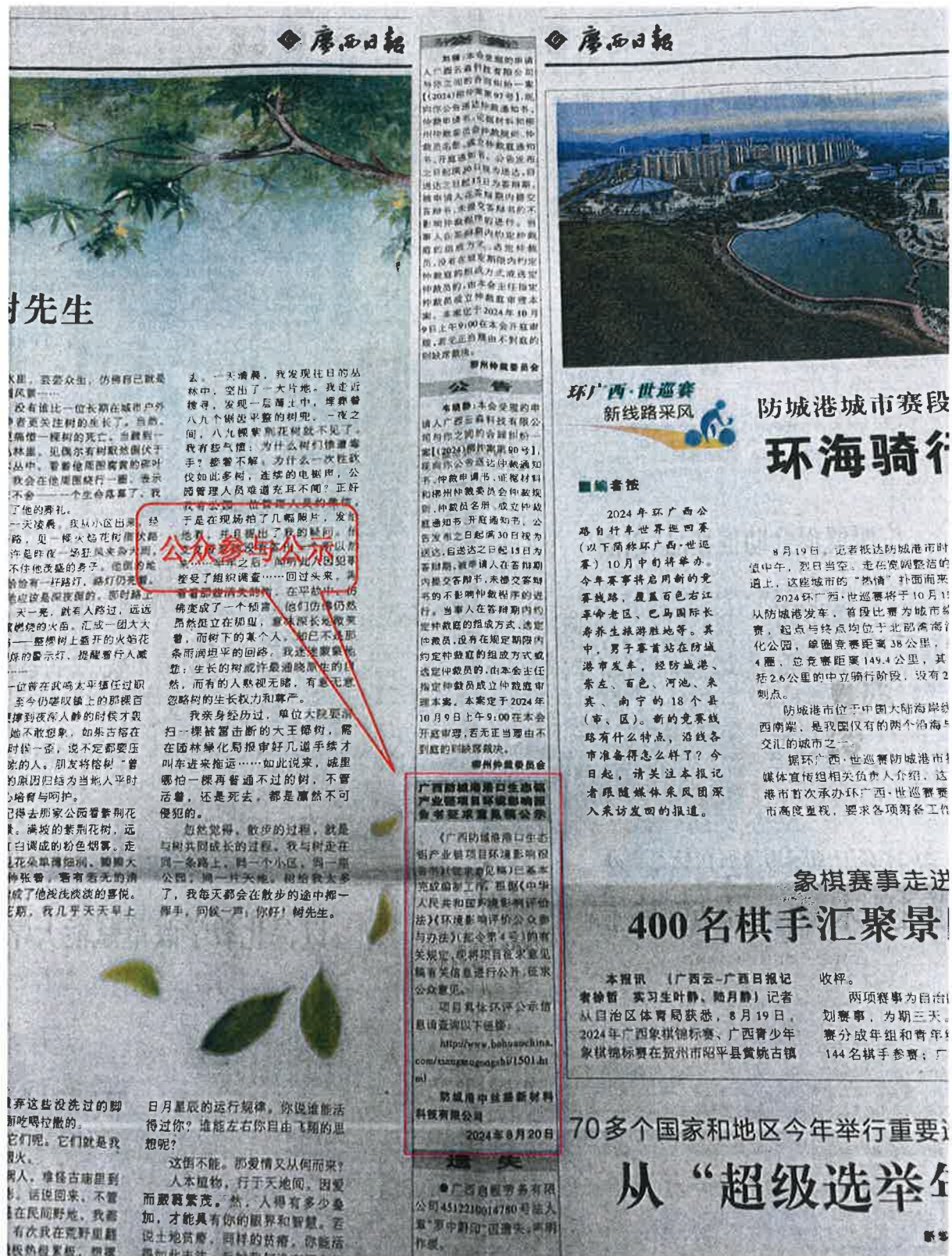
图 3.2-2 环境影响评价公众参与报纸公示 (2024.8.20)

公示。该报纸有较大发行量，受众面广，是本次公众参与调查良好的传播载体。详见图 3.2-2、图 3.2-3。