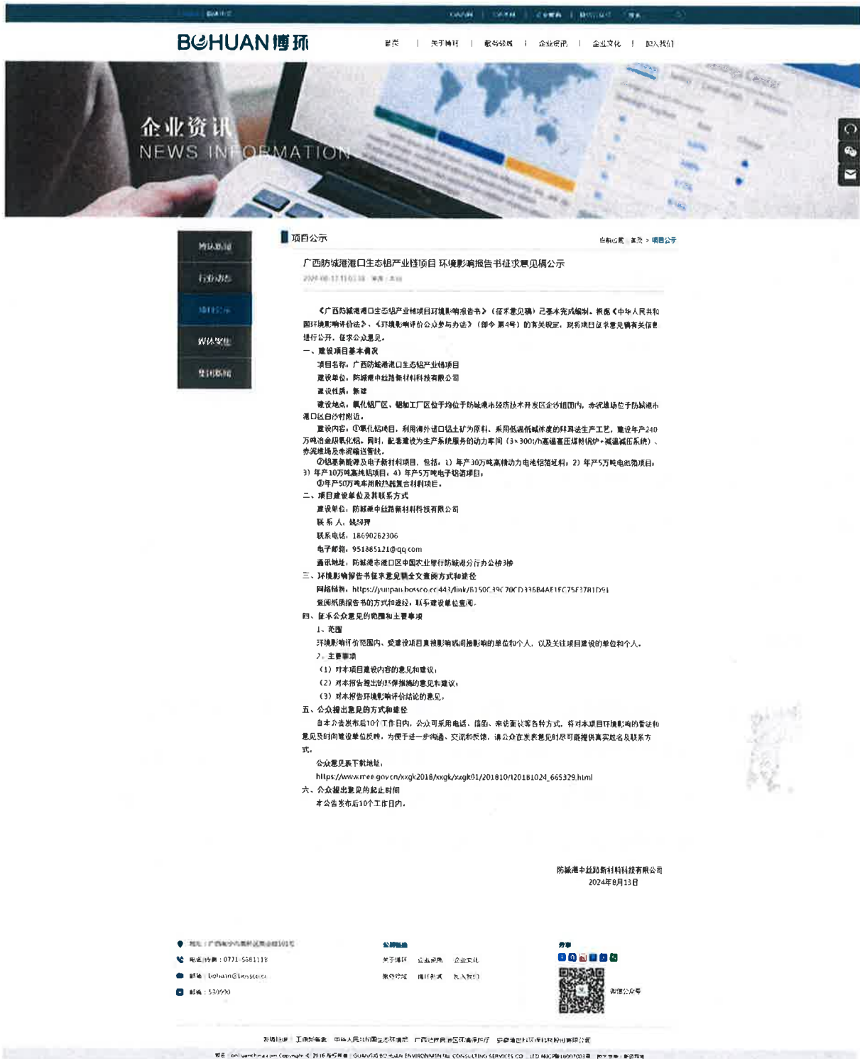
图 3.2-1 征求意见稿网上公示截图