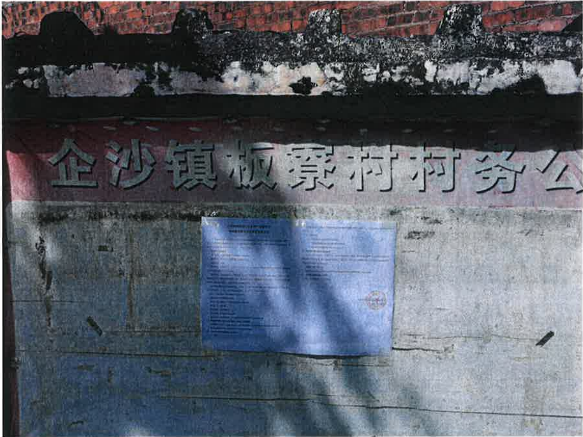
图 3.2-4 板寮村公示张贴照片

示栏、公告栏等公众易于知悉的场所，张贴的时间为2024年8月13日，张贴场所主要包括板寮村、赤沙村、虾笏村、白沙村、响水村，符合《环境影响评价公众参与办法》“通过在建设项目所在地公众易于知悉的场所张贴公告的方式公开，且持续公开期限不得少于10个工作日”的要求，张贴照片见图3.2-4~图3.2-8。