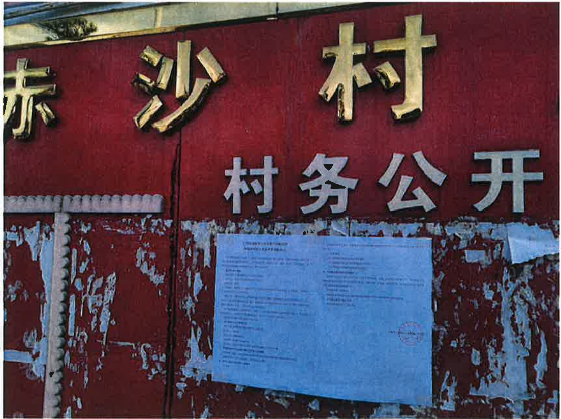
图 3.2-5 赤沙村公示张贴照片