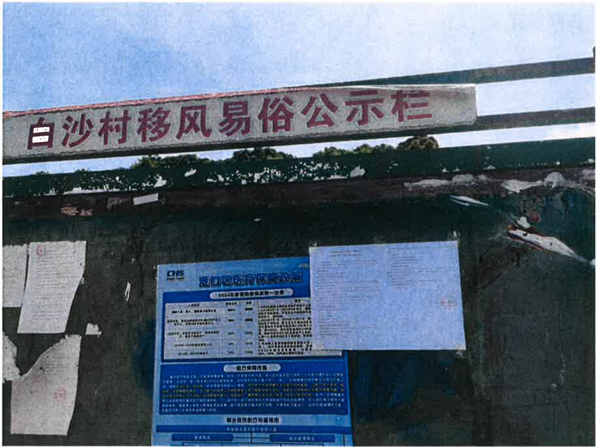
图 3.2-6 白沙村公示张贴照片