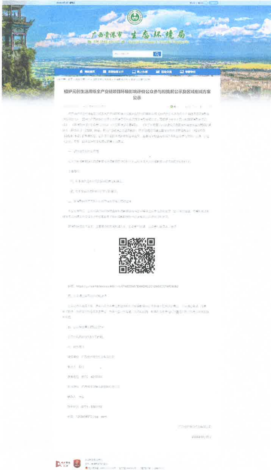
图6.1-1 报批前公示网上截图