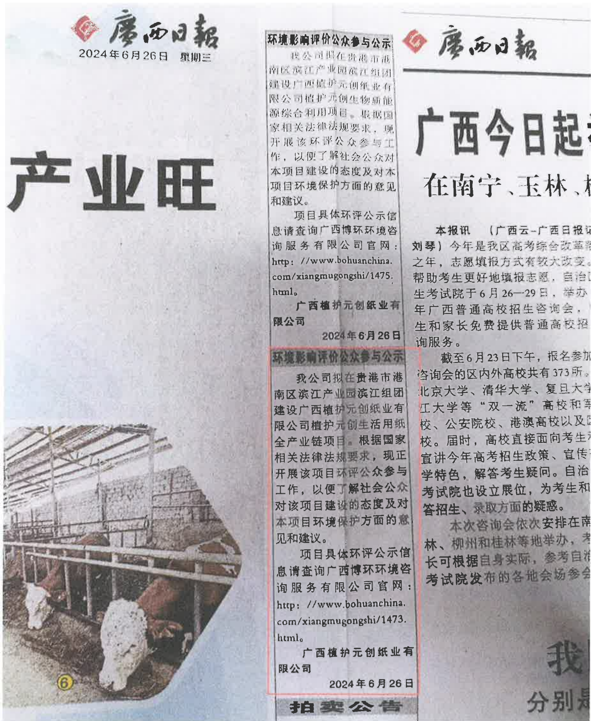
图3.2-3 征求意见稿登报公示情况（2024年6月26日）