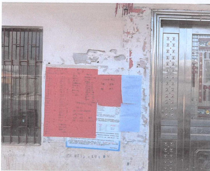
图 3-4 大垱村现场张贴公示

项目于2024年1月3日~2024年1月16日，在项目厂区及周边村庄进行了项目环境影响评价第二次公示现场粘贴，公示期限为公示发布后的10个工作日内。张贴照片见图3-4。