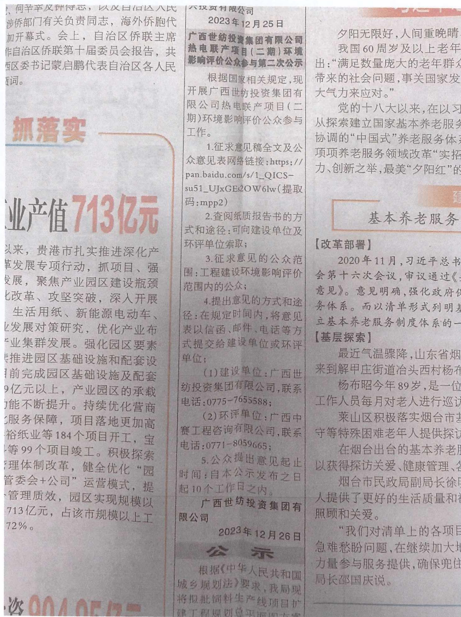
图 3-2 2023 年 12 月 26 日第二次公示报纸截图

我公司选取项目所在地公众易于接触的报刊“广西日报”于2023年12月26日与2023年12月27日分别发布了《广西世纺投资集团有限公司热电联产项目（二期）环境影响报告书》（征求意见稿）公示内容的网络链接。