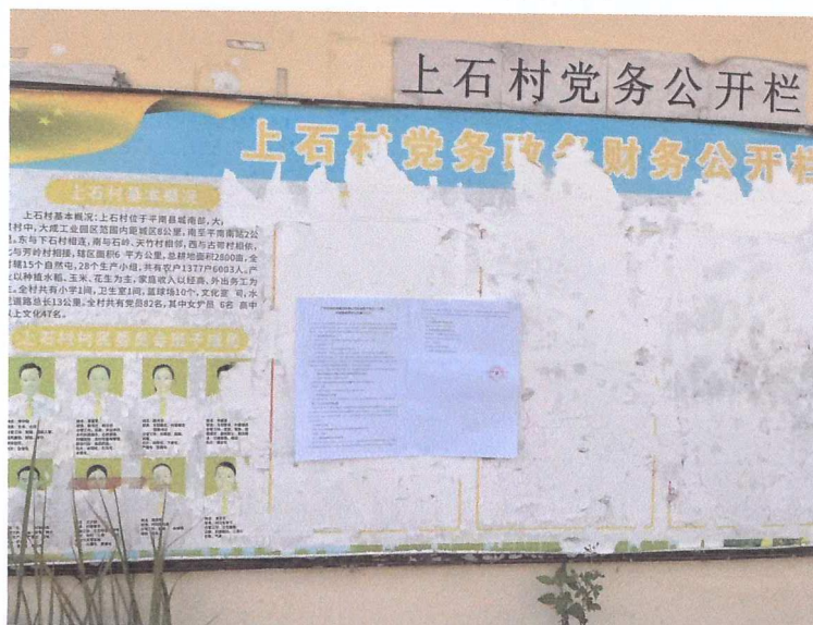
图 3-5 上石村现场张贴公示