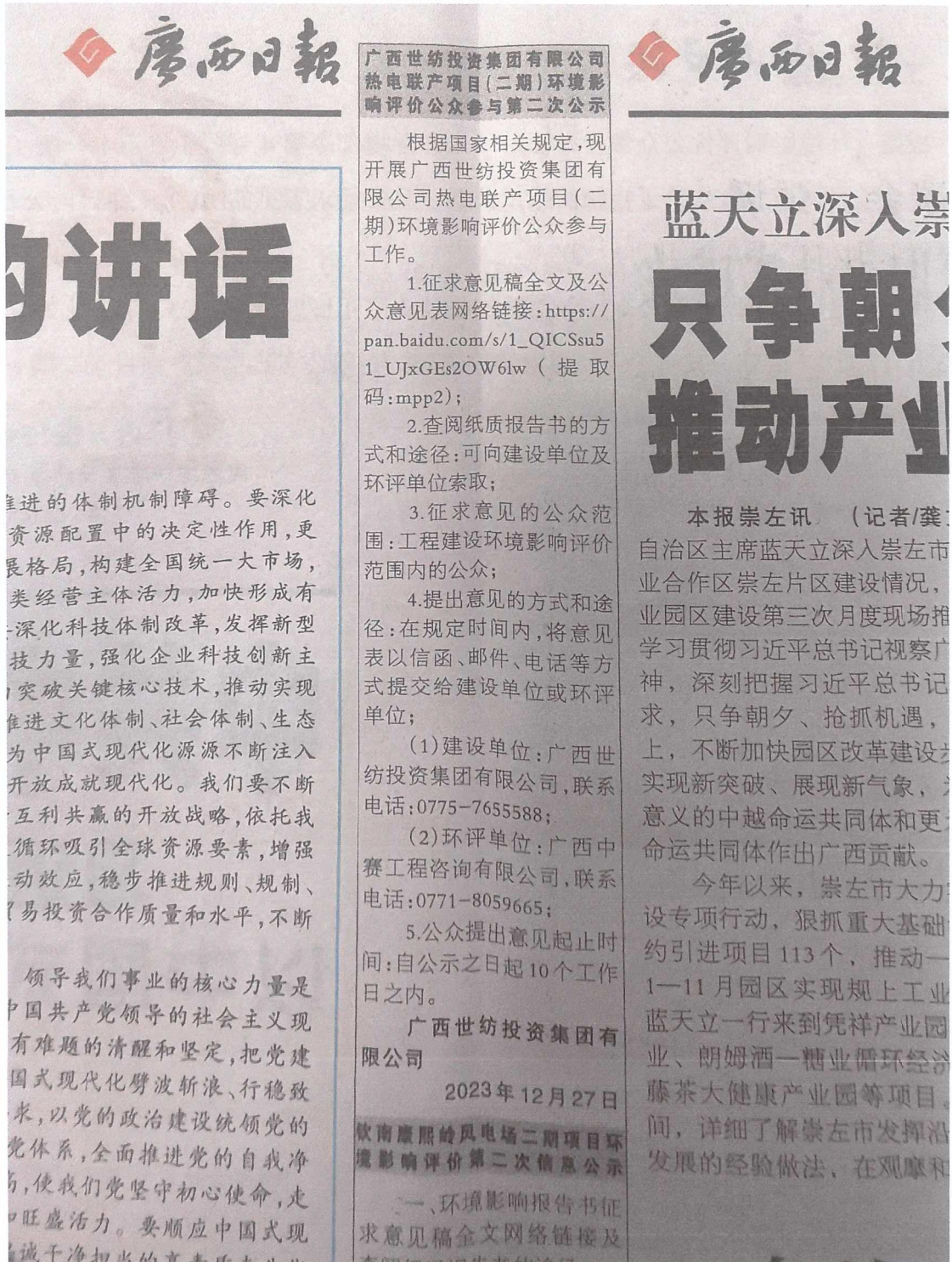
图 3-3 2023 年 12 月 27 日第二次公示报纸截图

广西日报是项目所在地公众易于接触的报纸，项目环境影响评价第二次公示报纸刊登的载体、次数、时限要求符合《环境影响评价公众参与办法》（生态环境部令第 4 号）的要求。