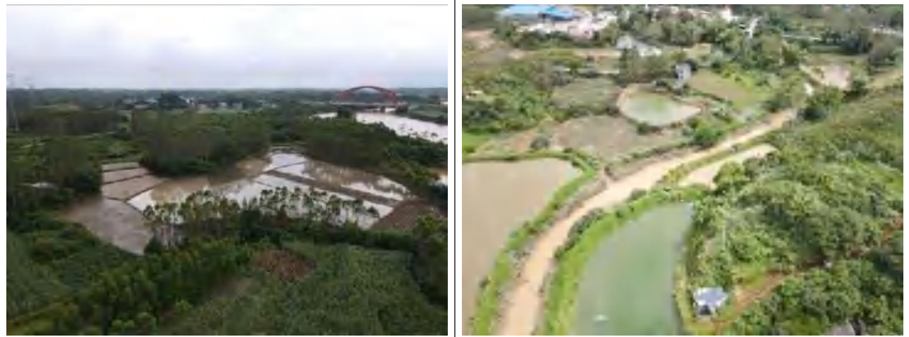
新建线路沿线地形地貌（农田、鱼塘、林地）