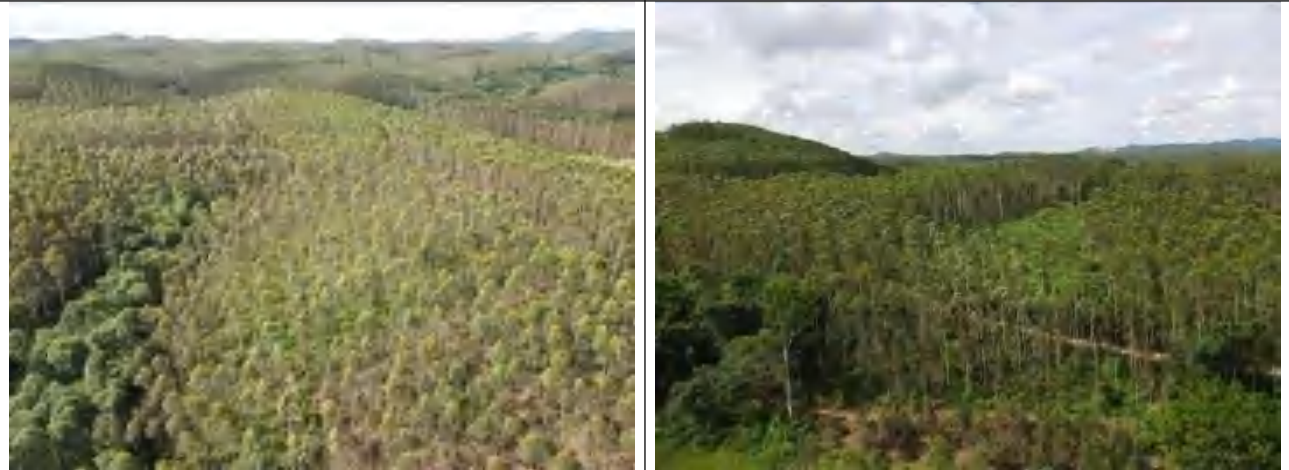
新建线路沿线地形地貌（桉树林地）