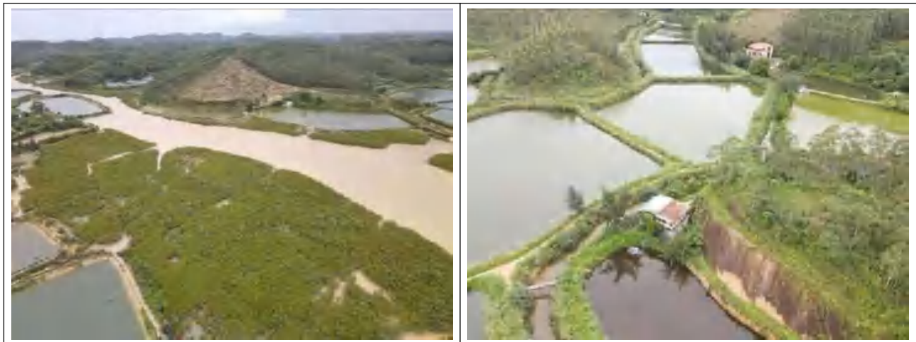
新建线路沿线地形地貌（河网泥沼地貌）

根据《中国地震动参数区划图》（GB18306-2015），新建输电线路场地所处区域 50 年超越概率为 10%的地震动峰值加速度均为 0.05g，对应的地震基本烈度为 6 度，反应谱特征周期为 0.35s。