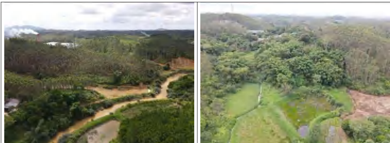
新建线路沿线地形地貌（林地、鱼塘）