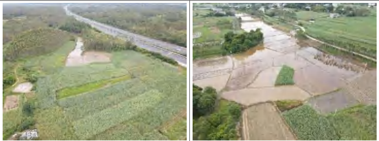
新建线路沿线地形地貌（农田）