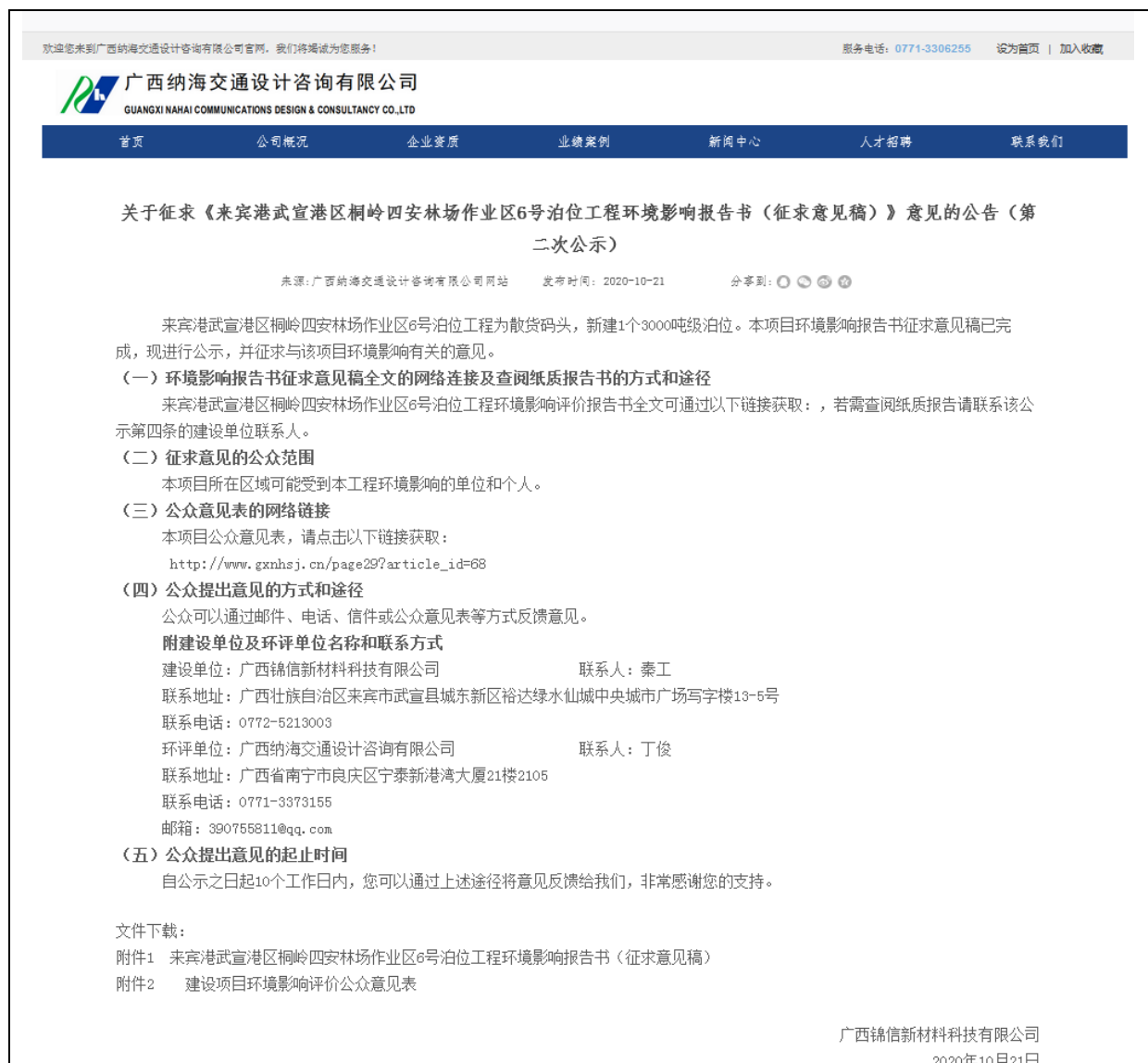
图 3.2-1 项目征求意见稿网络公示