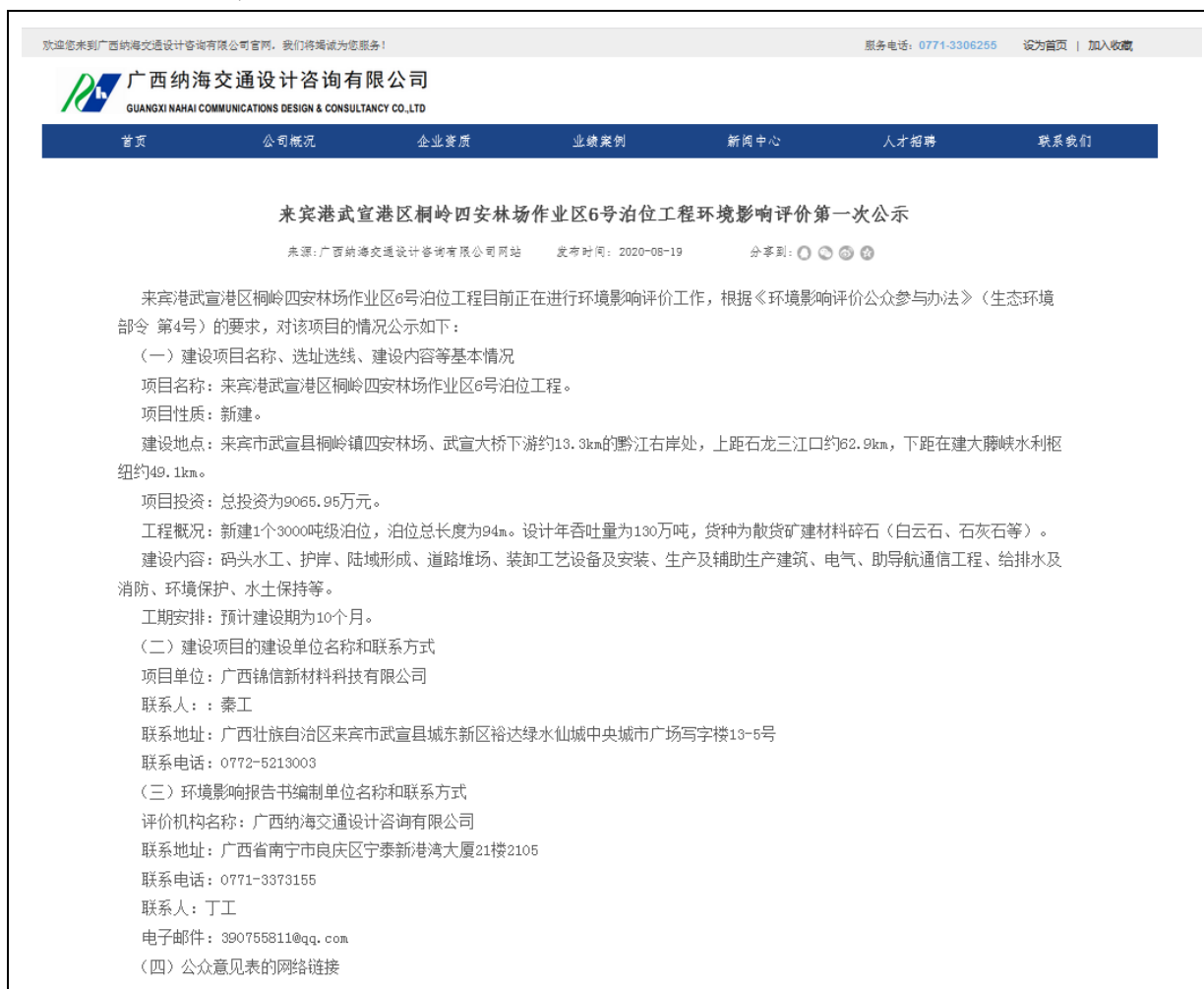
图 2.2-1 项目第一次网络公示