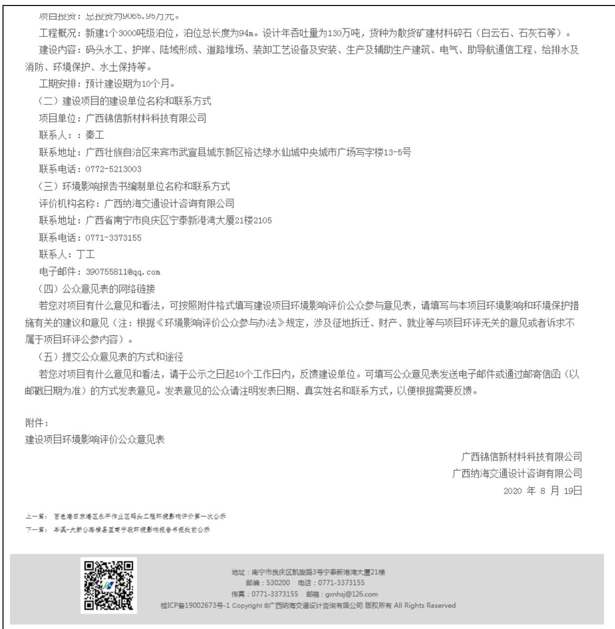
图 2.2-2 项目第一次网络公示