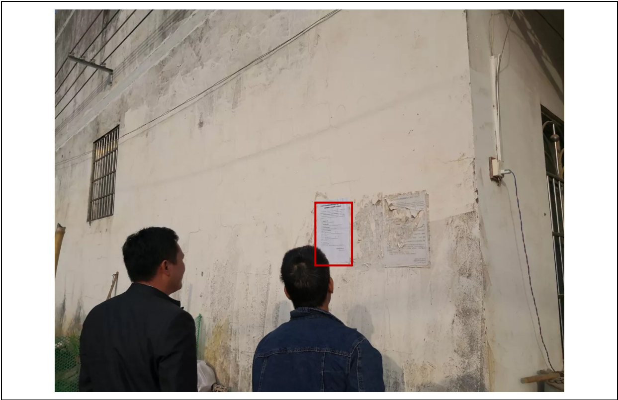
图 3.2-6 项目现场公示