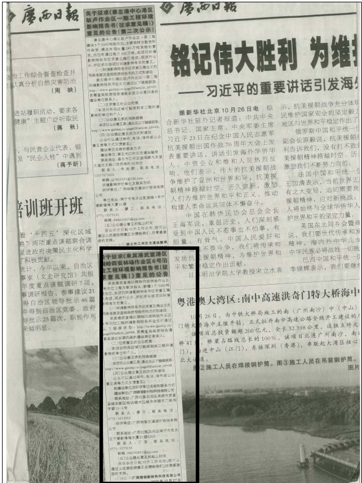
图 3.2-2 项目征求意见稿报纸第一次公示