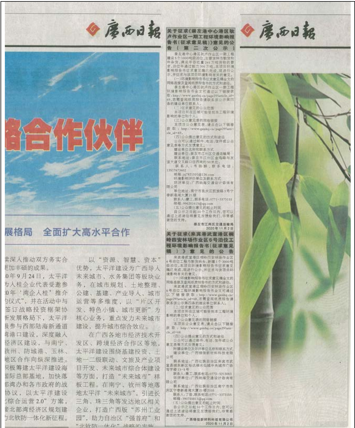
图 3.2-3 项目征求意见稿报纸第二次公示

本次现场公示选择项目附近的厂区公告栏中进行了现场张贴公示，张贴公示时间为：2020 年 10 月 21 日，张贴区域为评价范围内村庄，张贴区域符合《环境影响评价公众参与办法》，现场公示照片详见下图 3.2-4~3.2-7。