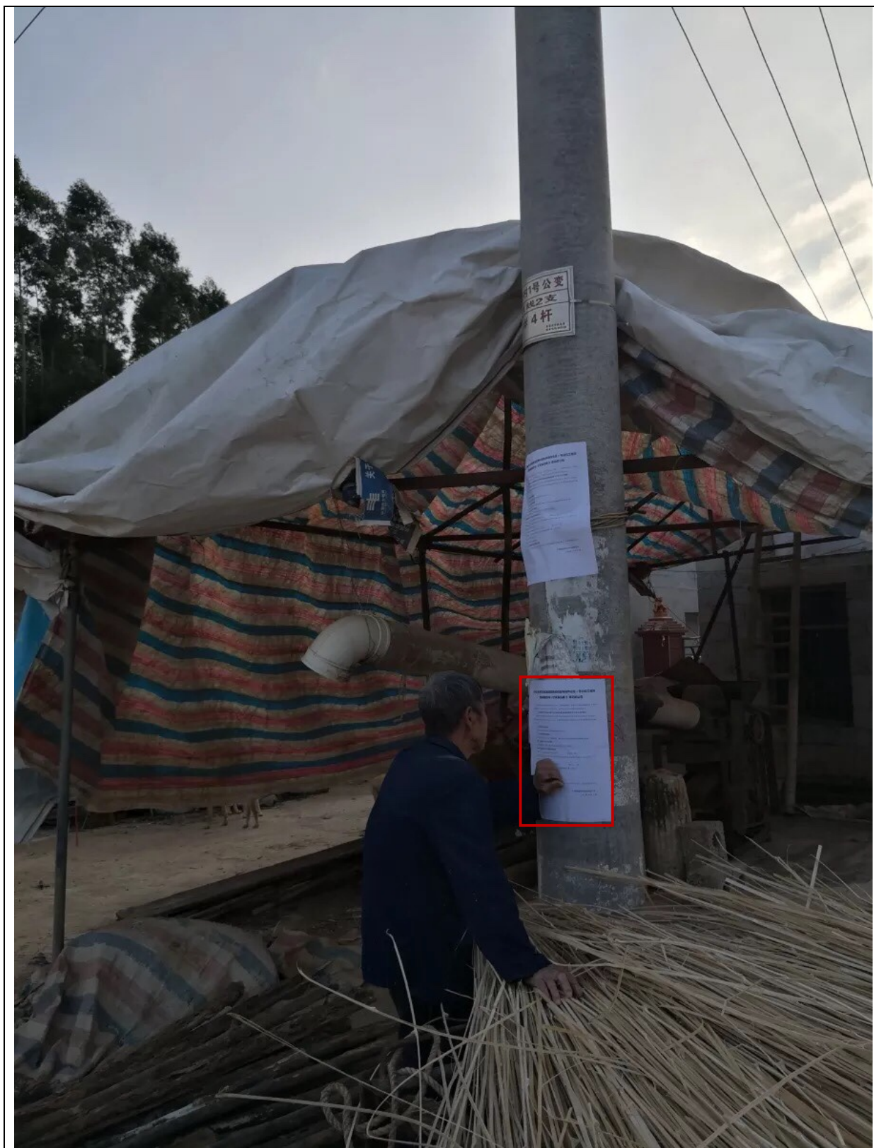
图 3.2-4 项目现场公示