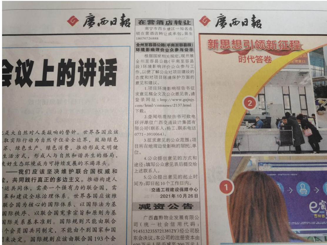
图3 本项目环境影响报告书征求意见稿报纸公示照片（第1次）

我中心于2021年10月26日和2021年10月27日分别在广西日报上公示了本项目的环境影响报告书征求意见稿，登报公示照片见图3、图4。