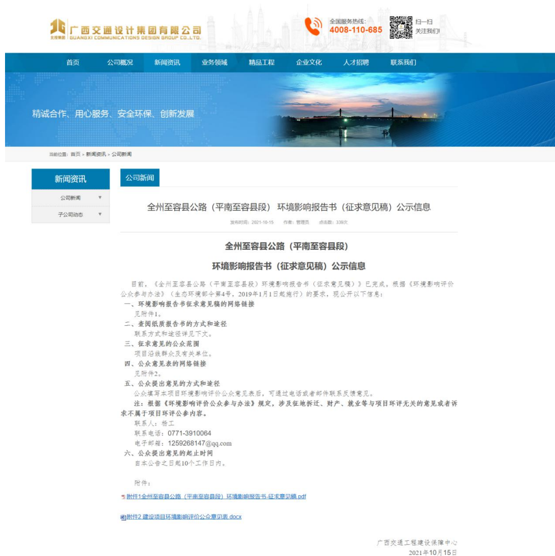
图 2 本项目环境影响报告书征求意见稿网上公示截图

我中心在网站 ( http://www.gxjtsjy.com/html/comnews/2137.html ) 上公示了本项目的环境影响报告书征求意见稿, 公示信息截图见图 2。