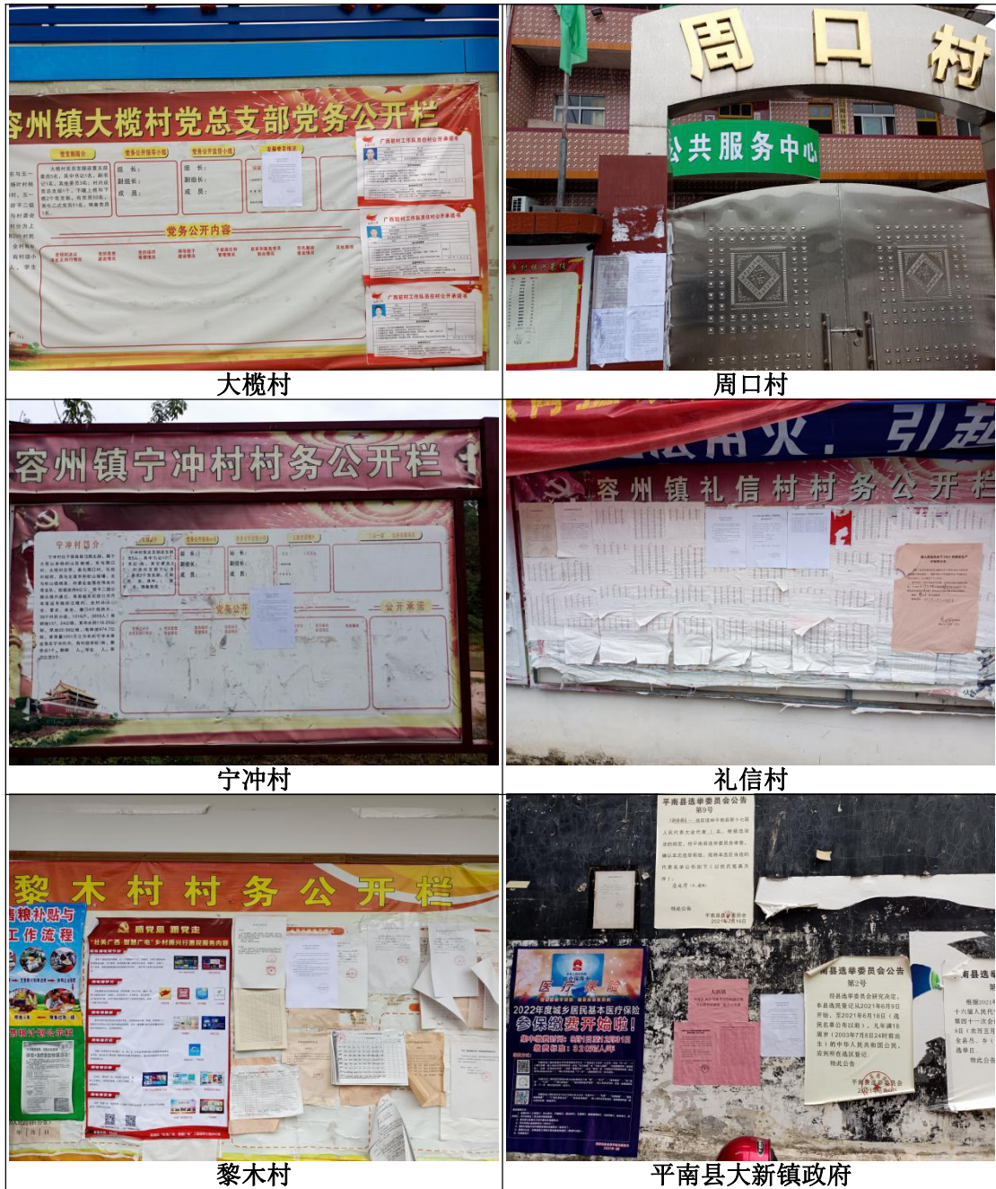
图 5 本项目环境影响报告书征求意见稿张贴情况现场照片