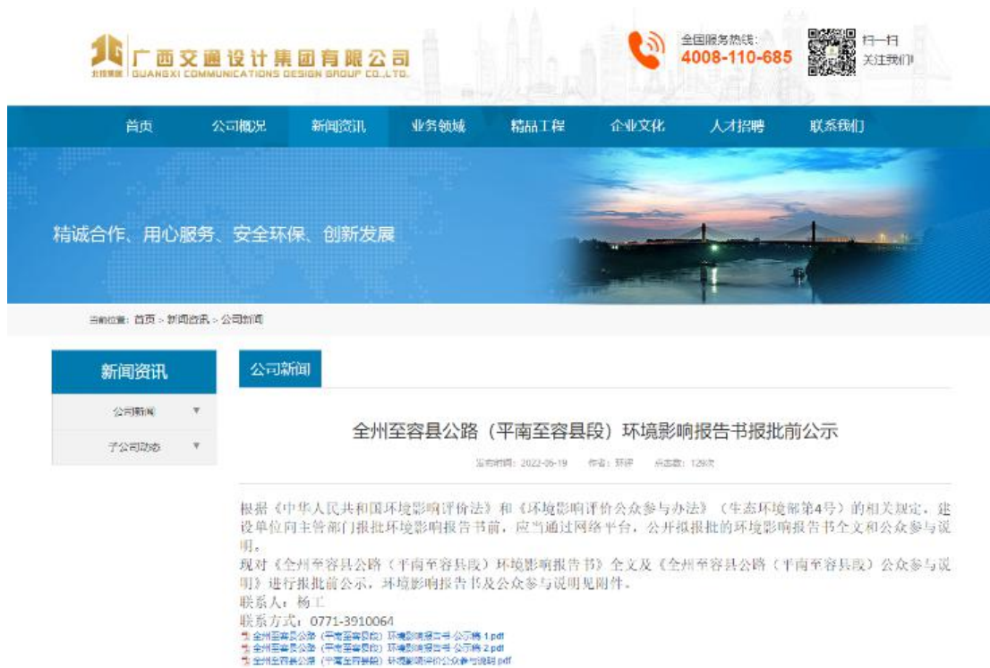
图 6 本项目报批前网上公示截图