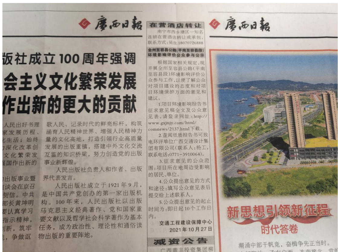
图 4 本项目环境影响报告书征求意见稿报纸公示照片（第 2 次）