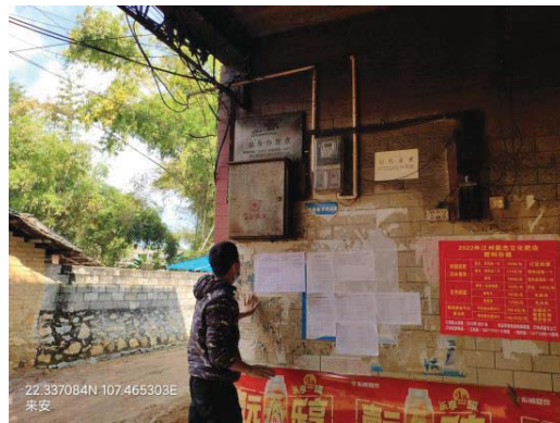
(b) 崇左市江州区来安村