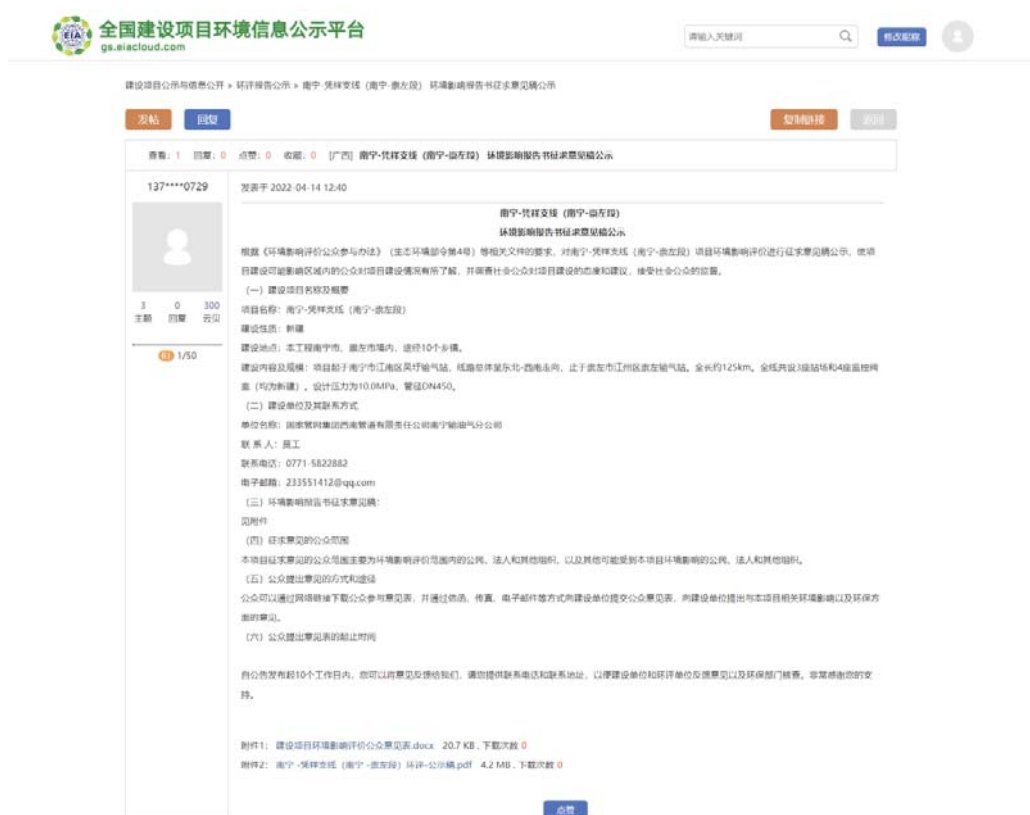
图 3.2-1 本项目征求意见稿公示网络截图