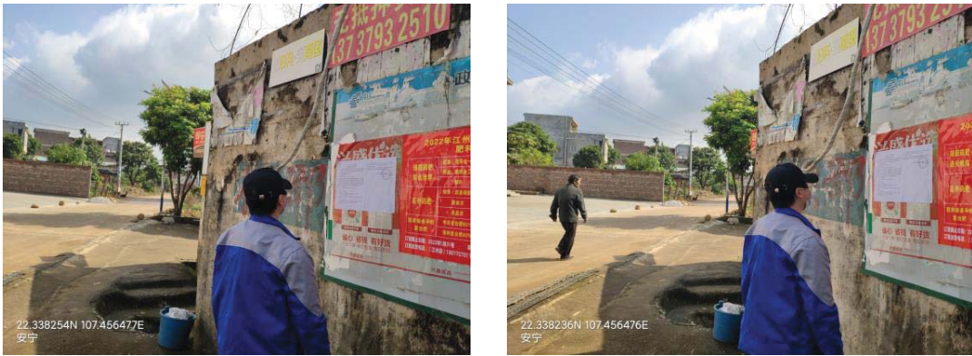
(c) 崇左市江州区安宁村