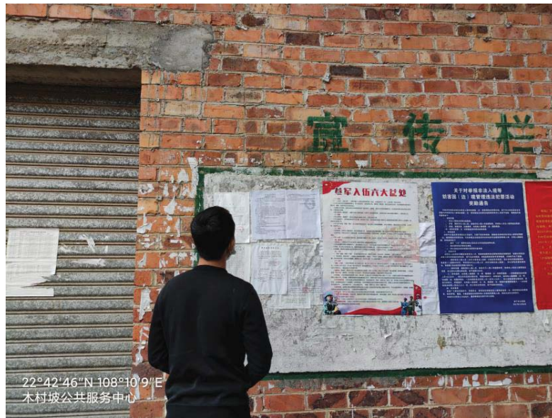
(a) 南宁市江南区木村

2022年04月18日~04月27日，建设单位选取南宁市江南区木村、崇左市江州区来安村张贴本项目环境影响评价报告书征求意见稿公示的公告，选取的张贴公告地点全部为本项目评价范围内环境保护目标。现场照片见图3.2.3-1。