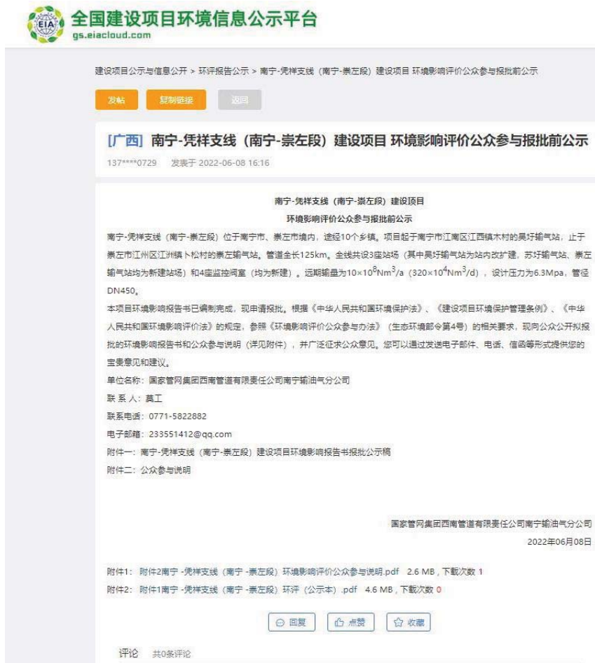
图 6.2-1 本项目报批前公示截图