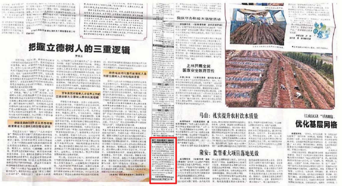
图 3.2-3 本项目环境影响报告书征求意见稿第二次报纸公示截图（2022 年 4 月 19 日）