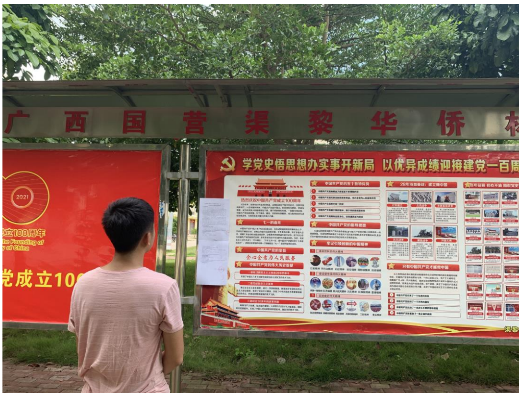
图 3-5 海报张贴公示图（2）