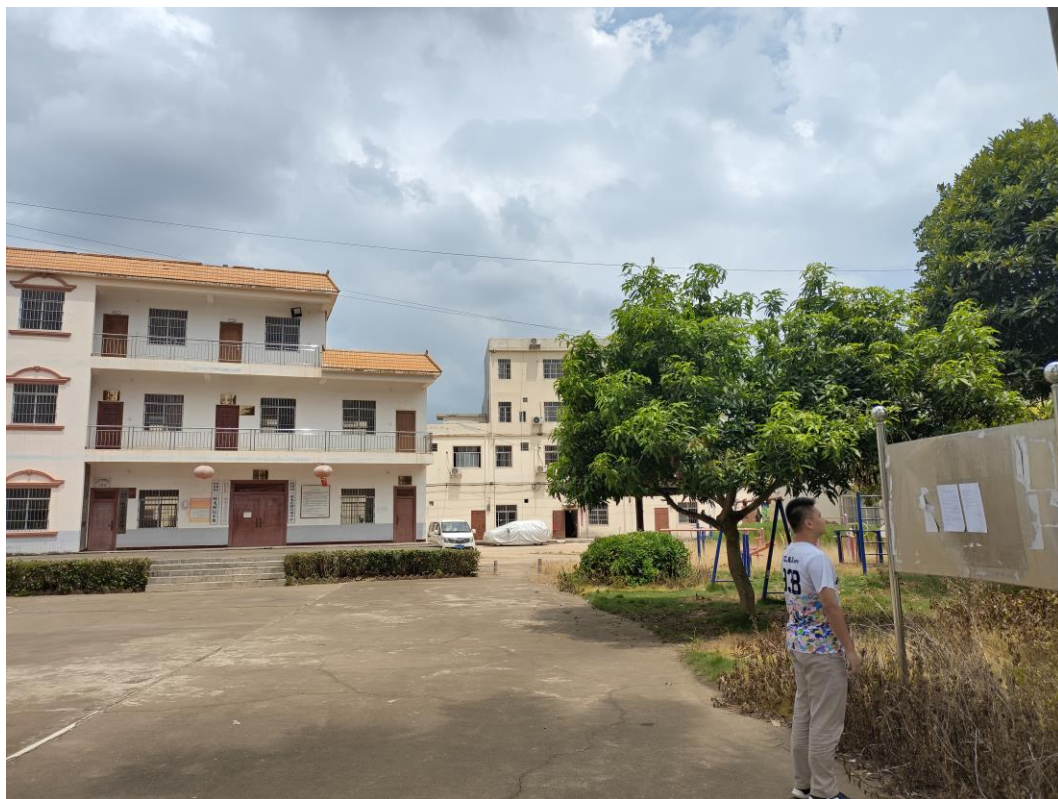
图 3-6 海报张贴公示图（3）