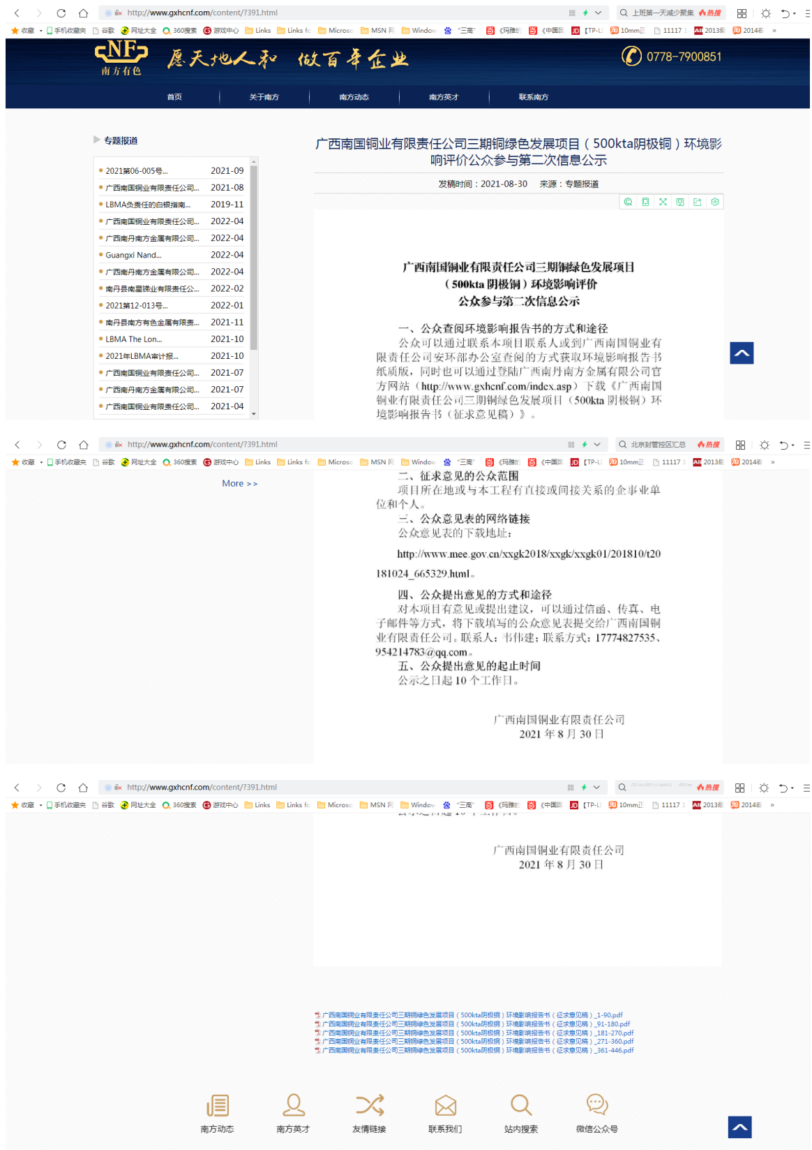
图 3-1 征求意见稿公示网络截图