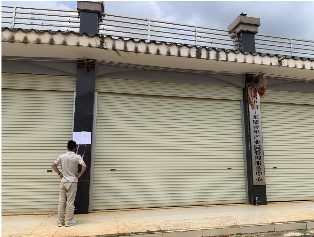
图 3-4 海报张贴公示图（1）