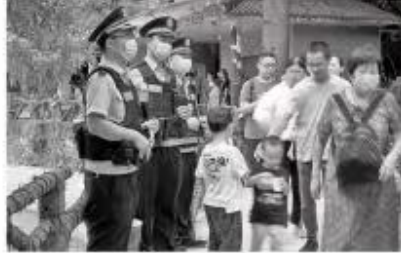
民警护游 节日期间，民警坚守岗位，为平安“加码”。

节日期间，民警坚守岗位，为平安“加码”。在各大景区、繁华街道，随处可见民警的身影。他们时刻保持警惕，加强巡逻防控，及时发现并处置各类安全隐患，确保节日期间的社会治安稳定。