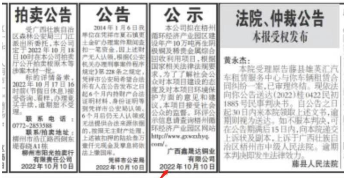
图 3.2-2 征求意见稿公众参与第一次报纸公示（11月7日）