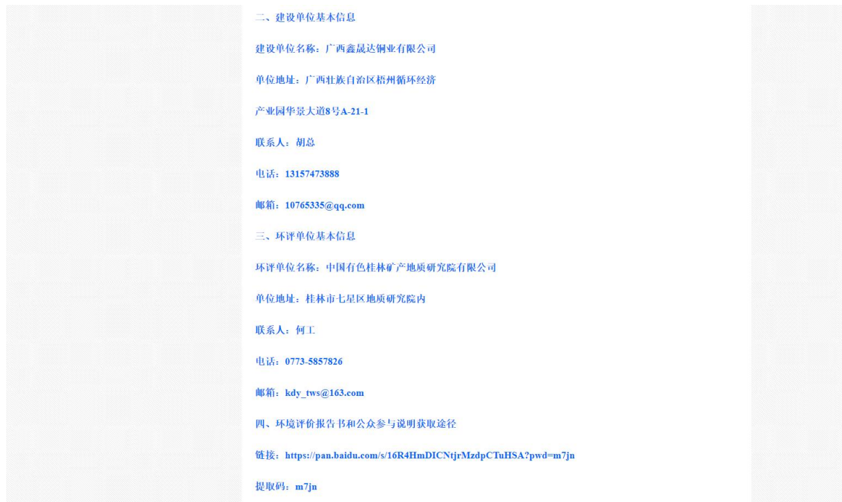
图 6.2-1 报批前公众参与网上公示