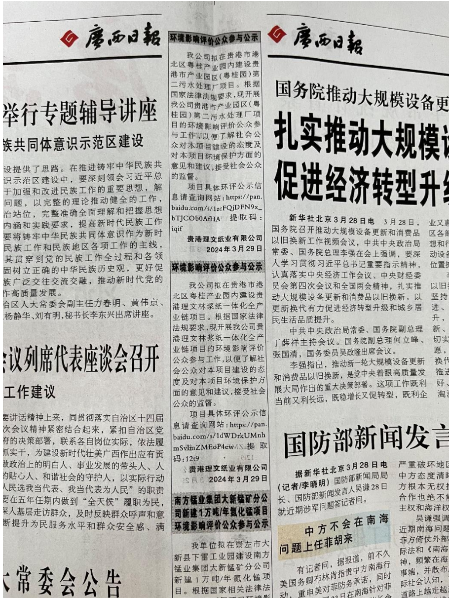
图 3.2-4 环境影响评价公众参与报纸公示 (2024.3.29)