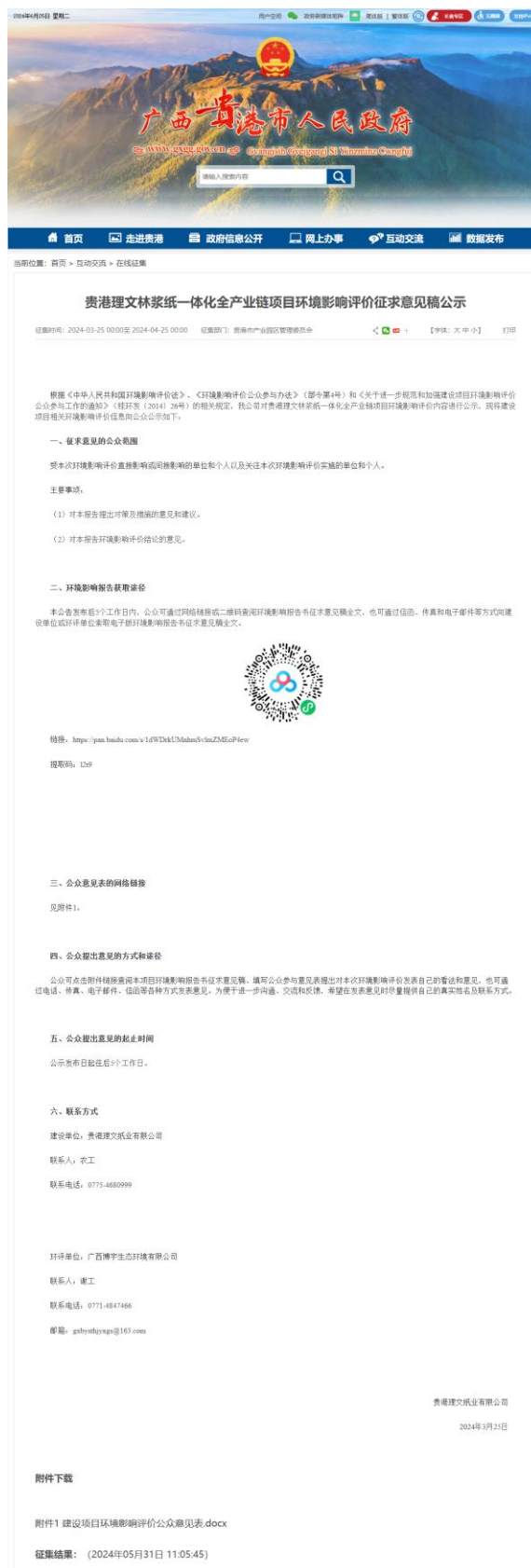
图 3.2-1 贵港市人民政府公示截图