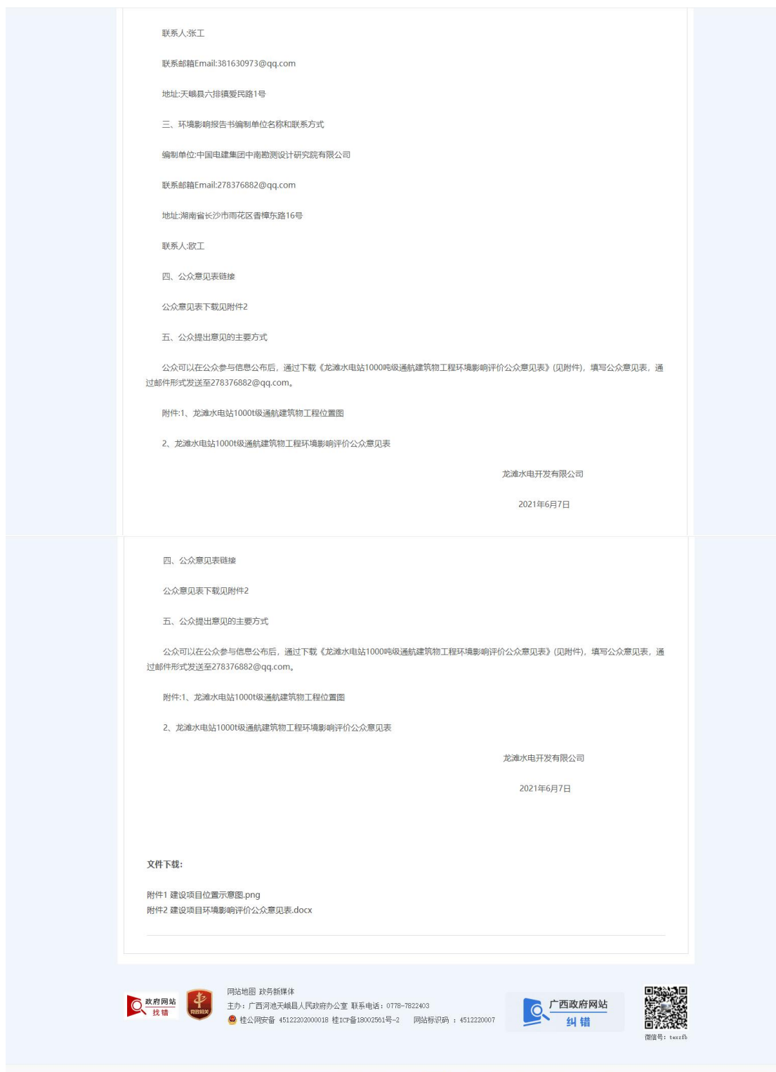
图 2.2 龙滩水电站 1000 吨级通航建筑物工程环境影响评价第一次网络信息公示