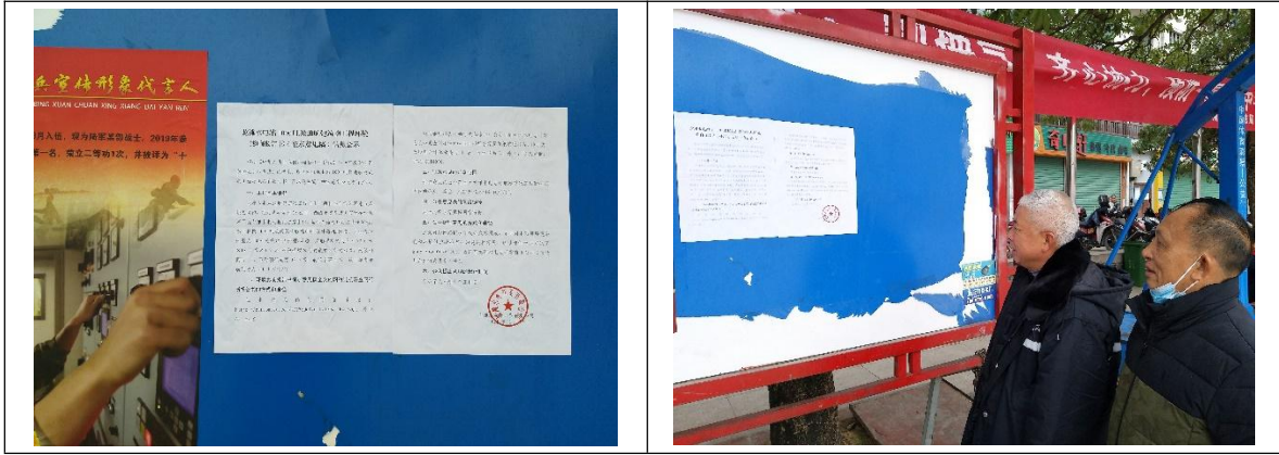
图 3.2-2 龙滩水电站 1000 吨级通航建筑物工程环境影响报告书(征求意见稿)张贴公示

目征求意见稿可通过在建设项目所在地公众易于知悉的场所张贴公告的方式公开,且持续公开期限不得少于10个工作日。我公司于2021年12月27日在工程所涉及的天峨县进行了龙滩水电站1000吨级通航建筑物工程环境影响报告书(征求意见稿)张贴公示,张贴区域、公示内容符合公参办法要求。龙滩水电站1000吨级通航建筑物工程环境影响报告书(征求意见稿)现场公示情况见图3.2-2。