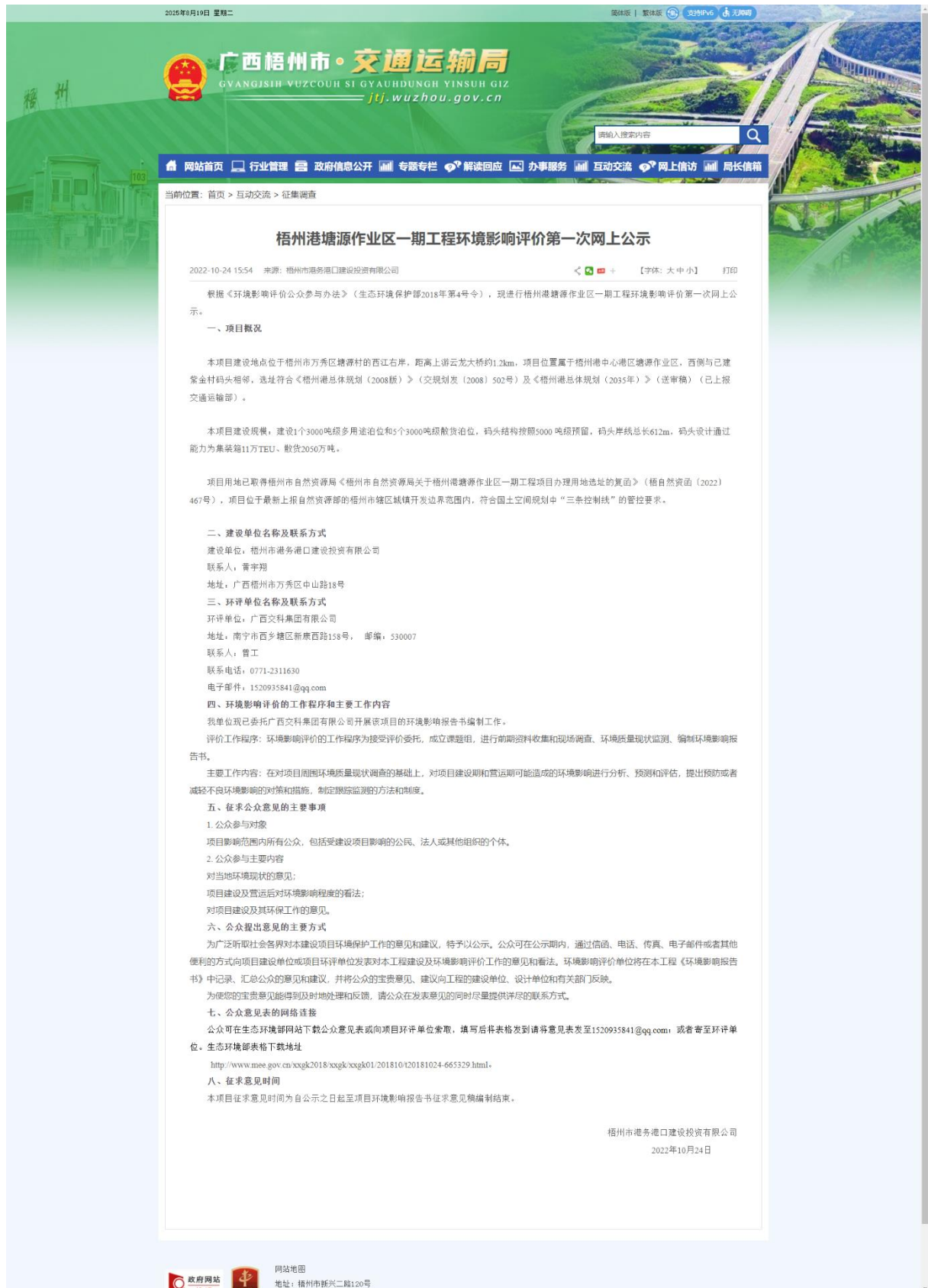
图 2-1 第一次网络公示截图