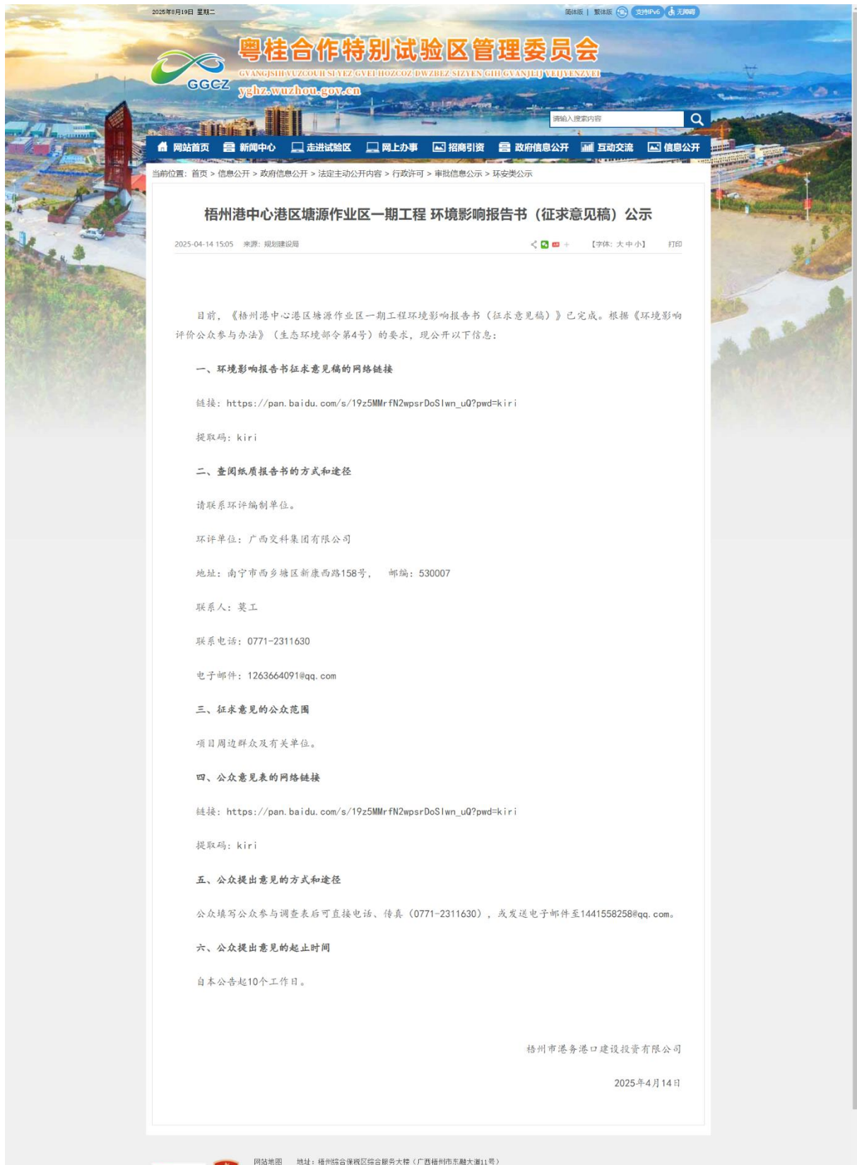
图 3-1 征求意见稿公示见截图