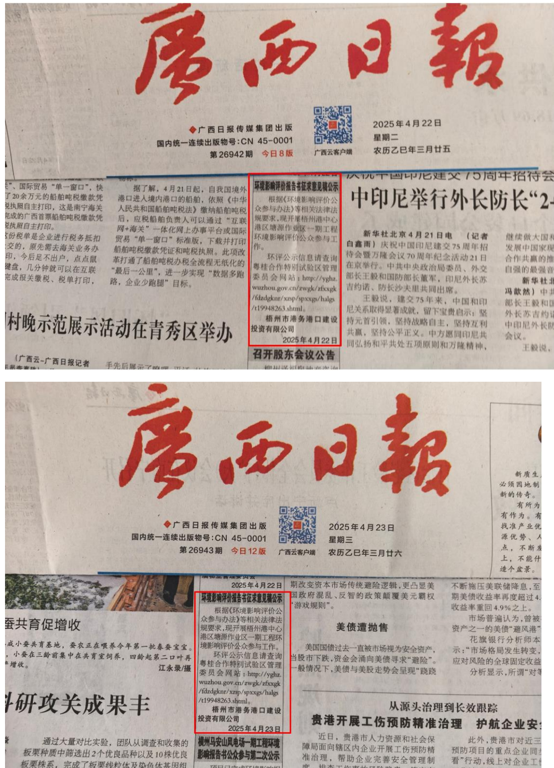
图 3-2 本项目登报信息情况

年4月23日在广西日报报纸上公开信息，征求与该建设项目环境影响有关的意见，广西日报是本次项目所在地公众易于接触的报纸，载体选取合理，本项目登报信息如图3-2所示。