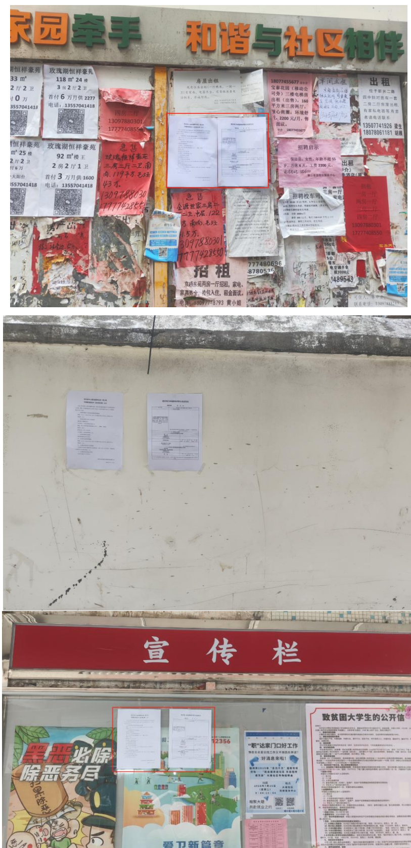
图 3-3 张贴结果