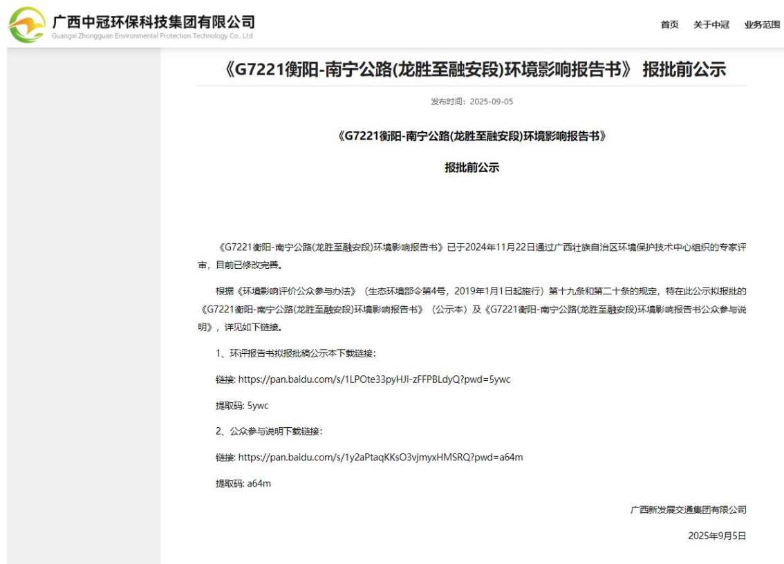
图 6-1 报批前公示情况截图

项目报批前于2025年9月5日在项目环评报告的编制单位广西中冠智合生态环境有限公司的集团公司官方网站（广西中冠环保科技集团有限公司）（ http://www.gxzgjt.cn/announcement_details/205.html ）上公示了本项目拟报批的环境影响报告书和公众参与说明，公示信息截图见图6-1。