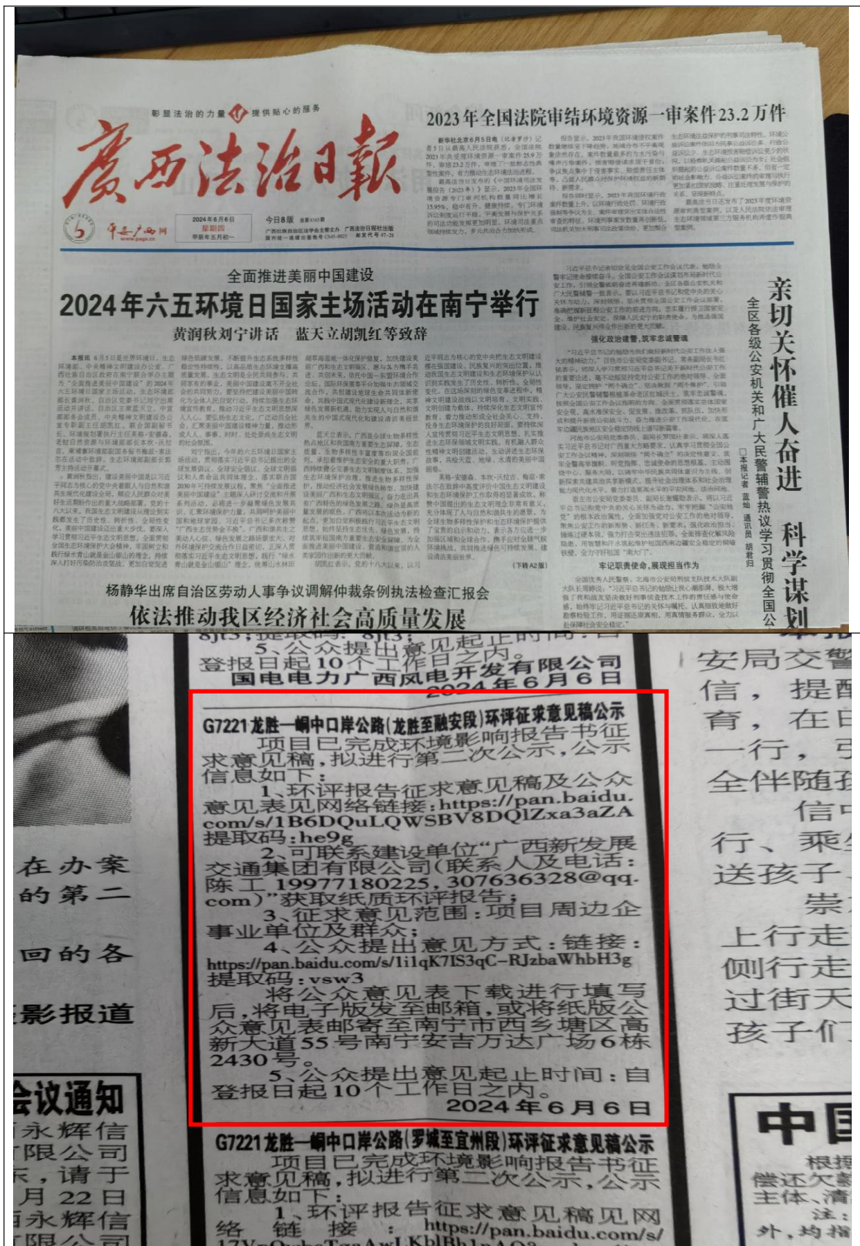
图 3-3 征求意见稿纸媒公示情况照片（2024 年 6 月 6 日）