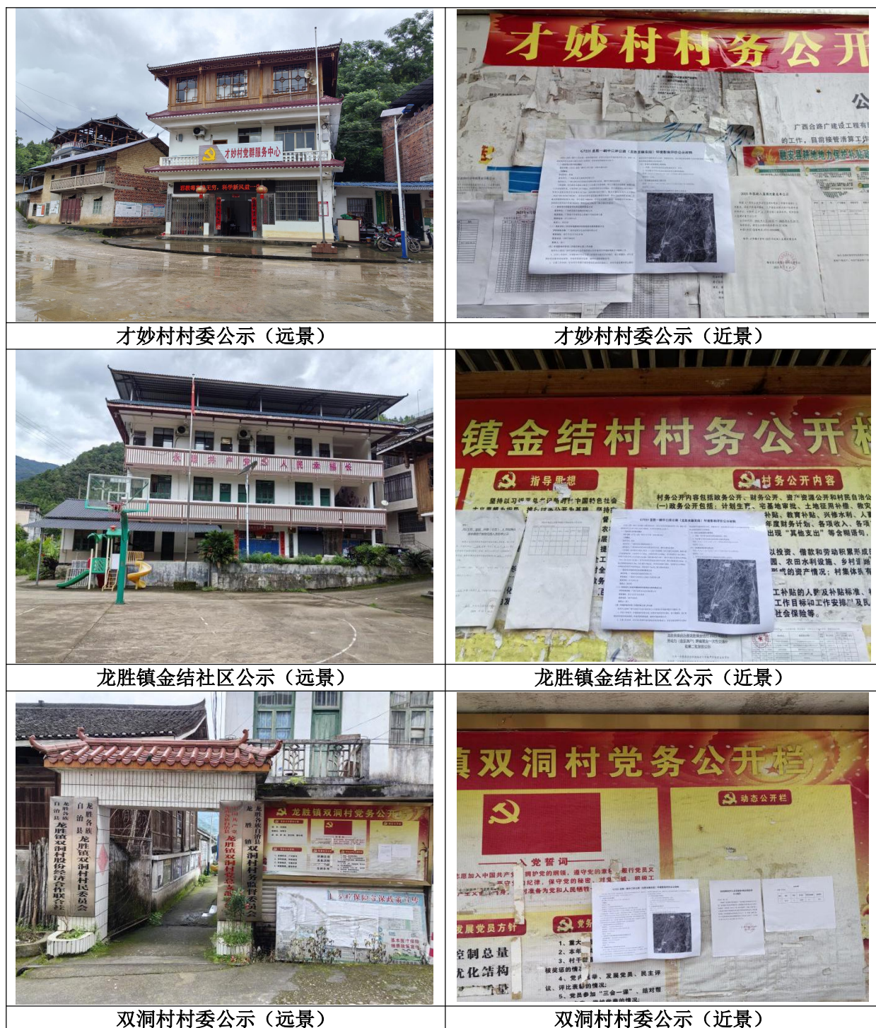
图 3-4 现场公示照片示意