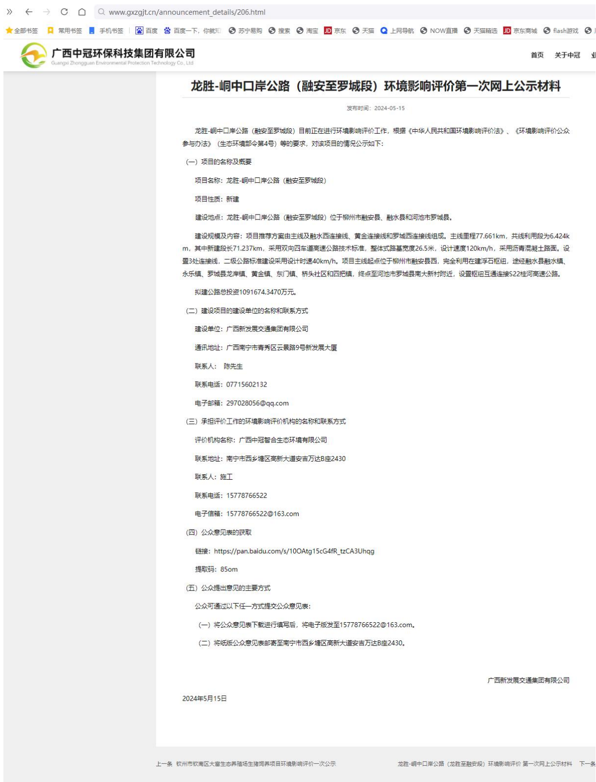
图 2-1 第一次网络公示情况截图