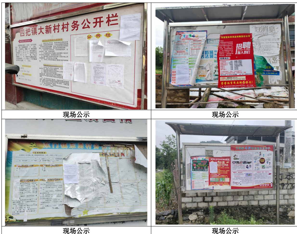
图 3-4 现场公示照片示意