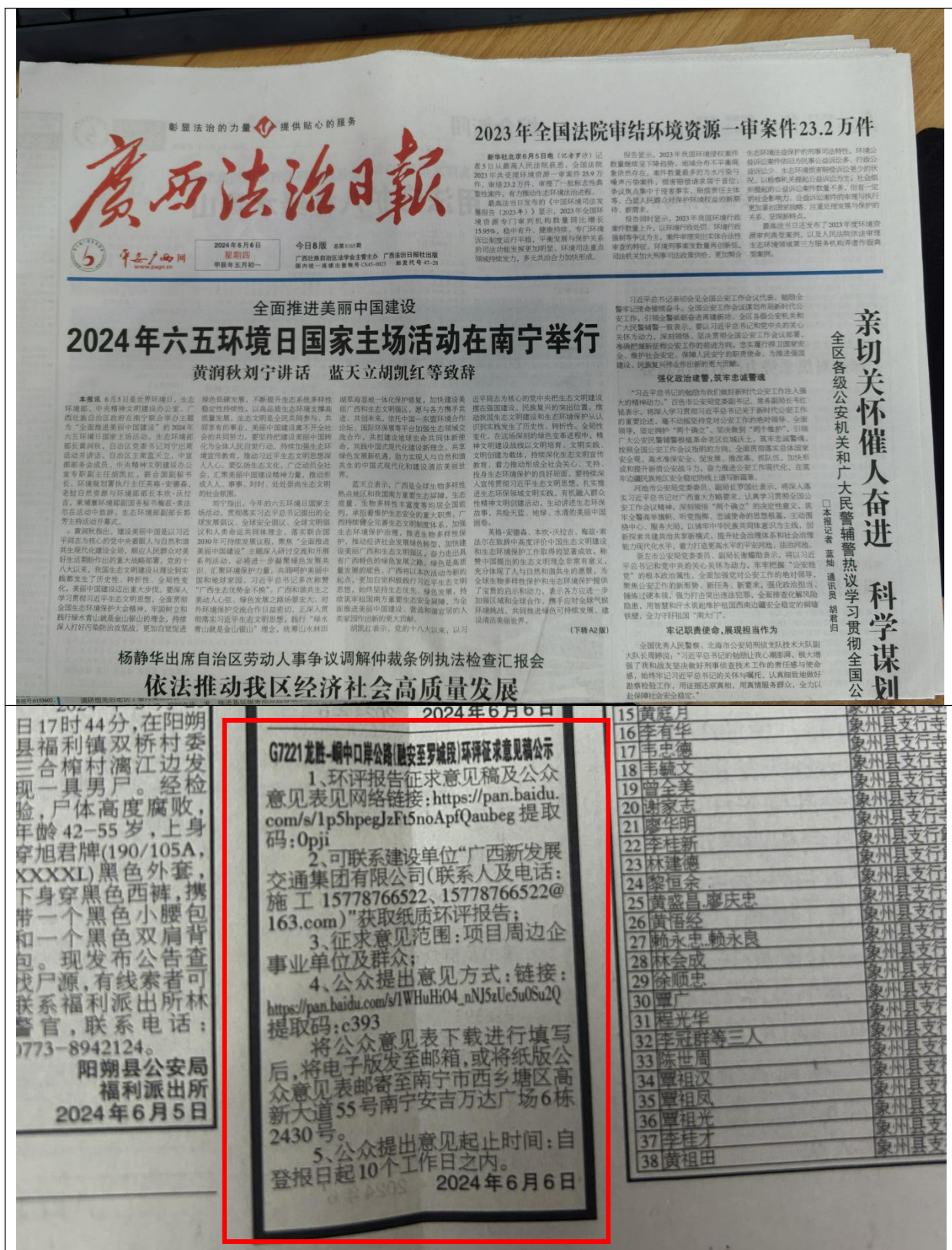
图 3-3 征求意见稿纸媒公示情况照片（2024 年 6 月 6 日）