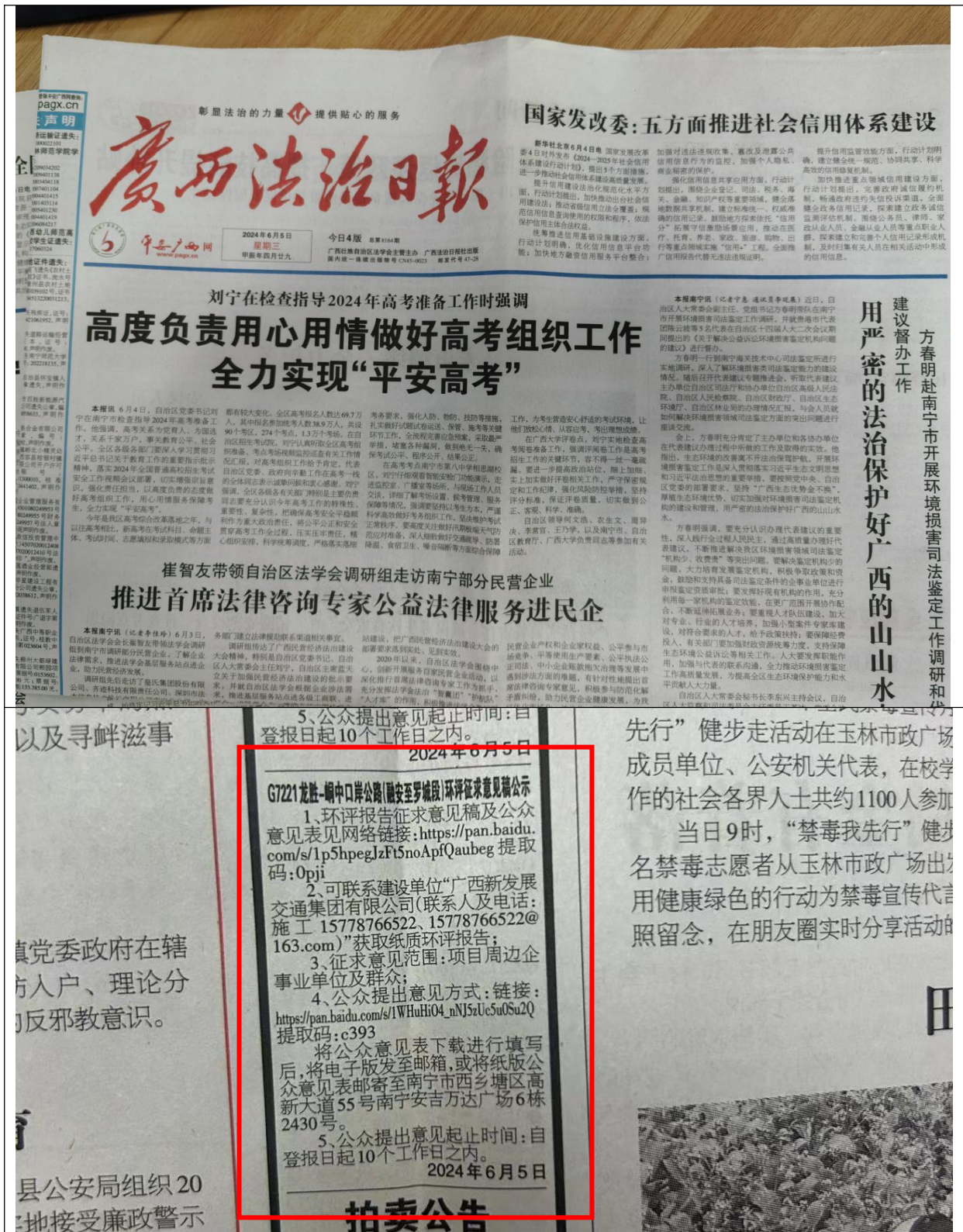
图 3-2 征求意见稿纸媒公示情况照片 (2024 年 6 月 5 日)