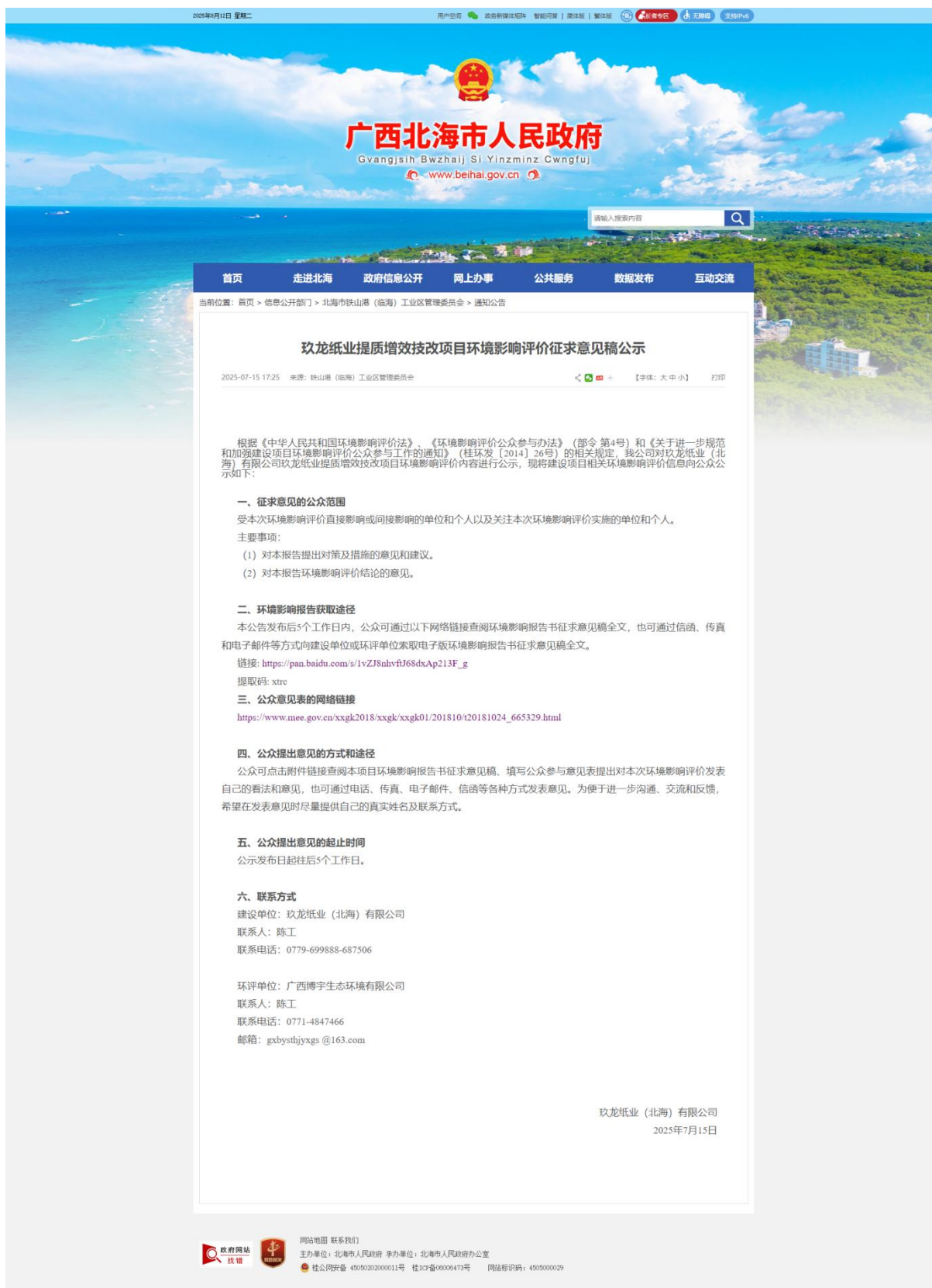
图 3.2-1 广西北海市人民政府网站公示截图