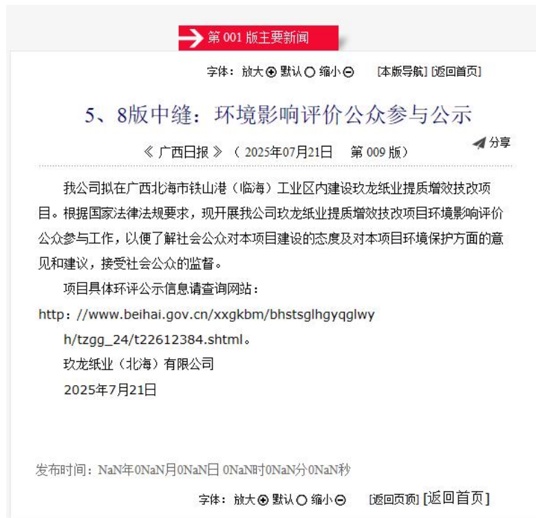
图 3.2-3 环境影响评价公众参与报纸公示（2025 年 7 月 21 日）