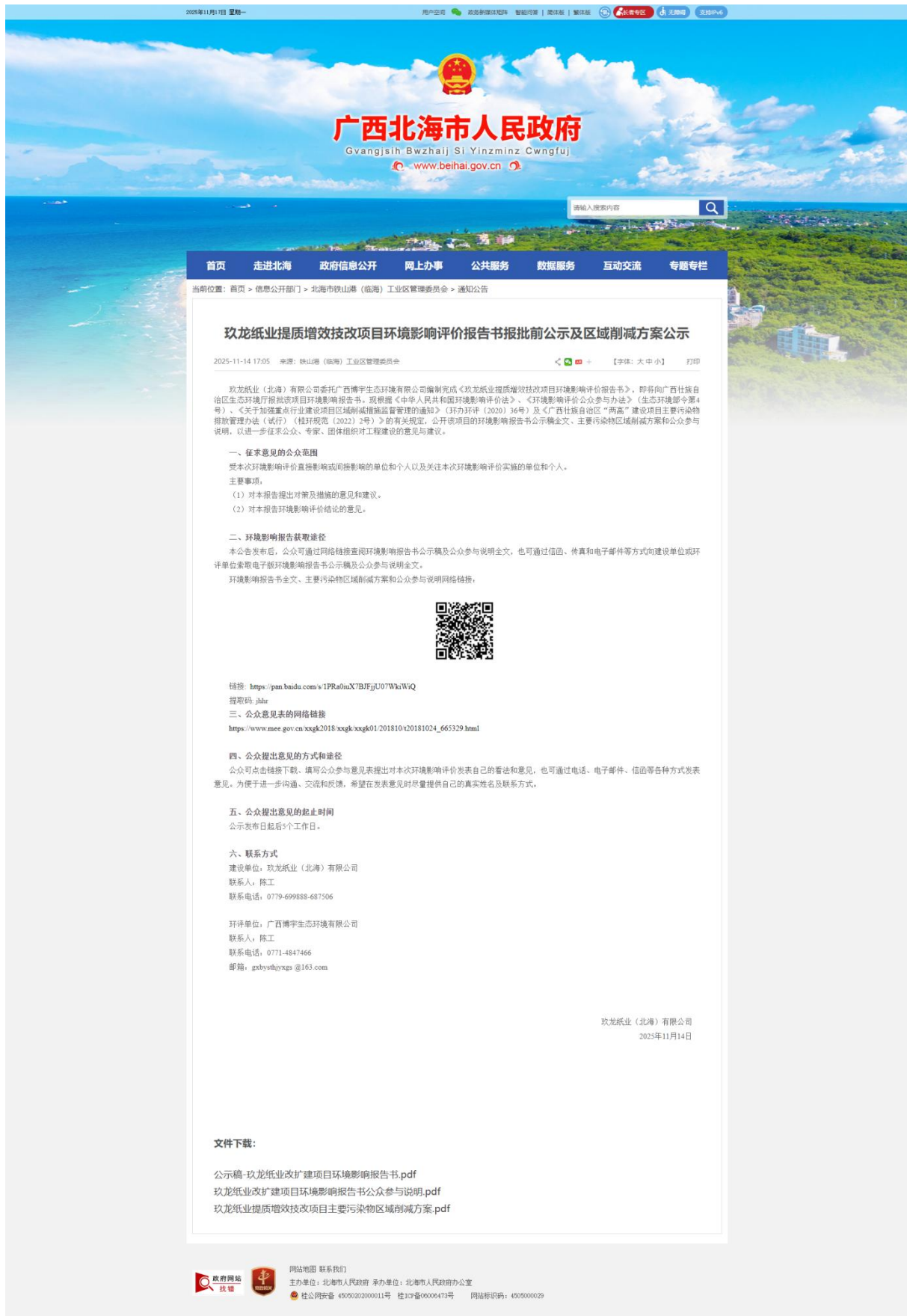
图 6.2-1 广西北海市人民政府网站公示截图