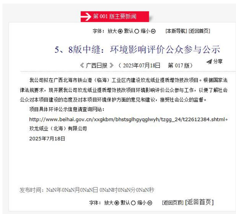
图 3.2-2 环境影响评价公众参与报纸公示（2025 年 7 月 18 日）